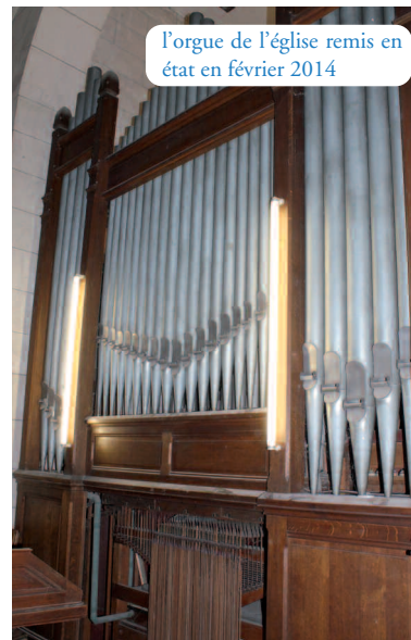
l'orgue de l'église remis en état en février 2014

A l'extérieur, les rejointoiements ont été entrepris sur le pourtour ainsi que sur l'ensemble de la façade ouest.