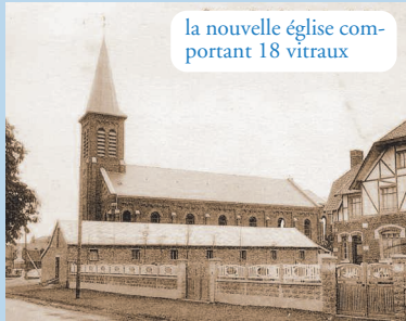
la nouvelle église comportant 18 vitraux

Plusieurs entreprises ont été contactées en 1924 pour les travaux de vitrerie. L'inauguration de l'église a eu lieu le 1 er mars 1925. Ce jour-là, en présence de l'abbé Joseph Maës, fondateur et curé de la paroisse, tous les vitraux étaient posés.