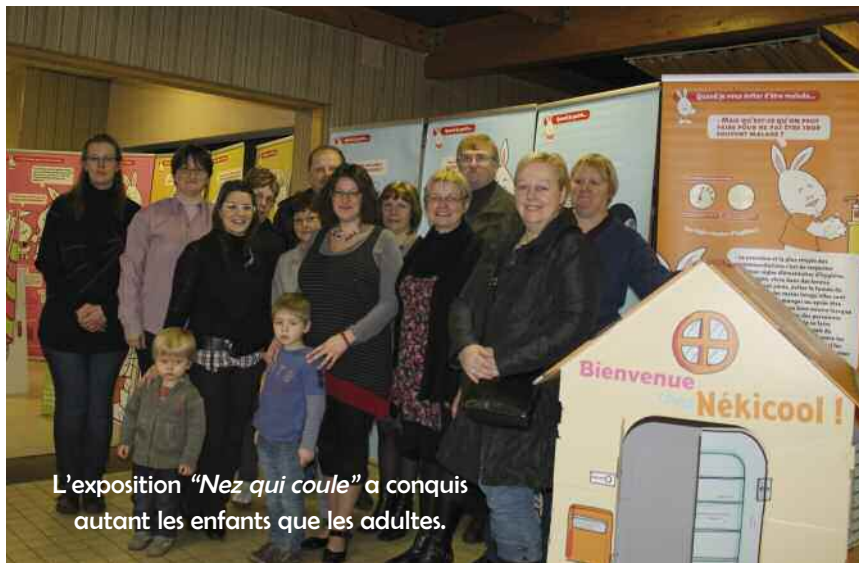
L'exposition "Nez qui coule" a conquis autant les enfants que les adultes.

A l'occasion de ses portes-ouvertes, le Relais Assistantes Maternelles (RAM) a organisé une visite des locaux du service à l'espace Elsa-Triolet situé parc Aragon.