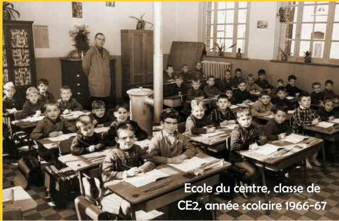
Ecole du centre, classe de CE2, année scolaire 1966-67

Dans le cadre des « Journées du patrimoine », qui auront lieu pour la 1 ère fois dans notre ville, les 17 et 18 septembre à l'école Morieux, le cercle historique de Grenay organisera une exposition de photos de classe prises dans notre ville. Soutenue par la municipalité et les responsables de l'établissement scolaire, l'association recherche des photos datant des années 1920 à 1980. Afin de les aider, les organisateurs vous invitent à les contacter.