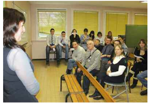
Les résidents ont découvert un diaporama revenant sur le projet auquel ils ont pris part.

Afin de se retrouver, élèves et résidents ont pris part à un diaporama sur le thème « espace rural et environnement ». Les résidents ont également pu apprécier une exposition dans le hall du bâtiment de la SEGPA.