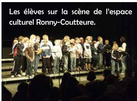
Les élèves sur la scène de l'espace culturel Ronny-Coutteure.