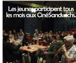
Les jeunes participent tous les mois aux CinéSandwichs.