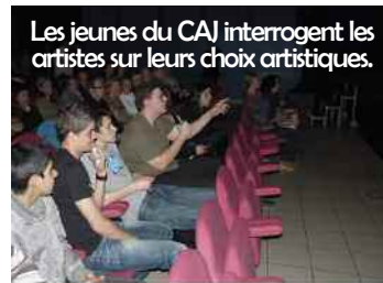
Les jeunes du CAJ interrogent les artistes sur leurs choix artistiques.

Dans une société où certains cherchent à opposer les catégories sociales, à Ronny Coutteure, on avait fait le choix du rassemblement : les habitants des cités, ceux de l'aire d'accueil, les services de police, l'Association Régionale d'Etude et d'Analyse Sociale des gens du voyage et le réalisateur du documentaire. Le débat a porté sur la criminalisation depuis 1912 d'une population qui souffre encore aujourd'hui de dichés. La réflexion a également posé la question du « vivre ensemble », qui plus que jamais est d'actualité.