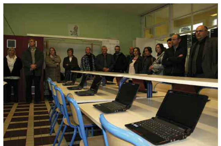
Des nouveaux « Net Books » pour les élèves.

Comme l'a souligné le maire, la municipalité a préféré s'orienter sur une classe mobile, plus équitable et plus souple d'utilisation. La ville a également investi dans l'achat de tableaux blancs interactifs (TBI) pour l'ensemble des écoles primaires et a rénové les deux classes pupitres. Les écoles maternelles bénéficient