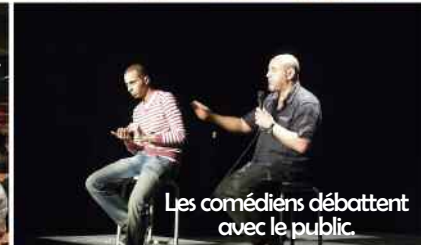
Les comédiens débattent avec le public.

Enfin, le jeudi 7 avril, avec la pièce de théâtre « Sans ailes et sans racines » se posait la question des relations père-fils et la transmission des valeurs. Hamadi, le père, immigré, né en terre d'Islam est un fervent défenseur de la laïcité et des valeurs républicaines. Il ne comprend pas le fondamentalisme religieux de Soufian, son fils. Spectacle d'actualité à l'heure où le débat sur « laïcité et religion » est mis en avant par le pouvoir et les médias. Un sujet aussi sensible ne peut pas être vu sans être suivi par un vrai débat. Nombreuses ont été