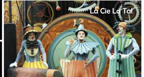
La Cie La Tal

Barcella vous emportera dans un voyage à travers le temps et les mots.