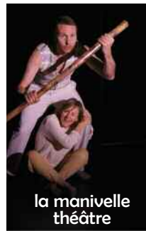
la manivelle théâtre