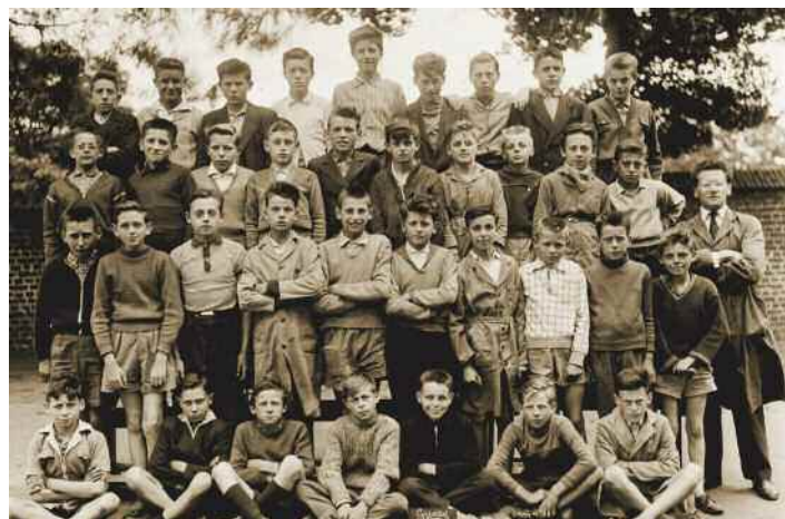
Ecole des garçons cité 5, 1959

Plus de 200 photos de classe de 1910 à 1980 seront présentées. Vous pourrez apprécier également une exposition sur l'histoire scolaire en France. Une classe à l'ancienne sera reconstituée et vous pourrez découvrir des documents originaux. Un film d'une vingtaine de minutes rassemblant des témoignages d'anciens