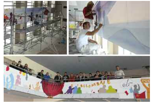
Les jeunes durant les travaux et sur le balcon devant un extrait de leur fresque.

En conclusion des « Chantiers d'été », une cérémonie a eu lieu à la salle des