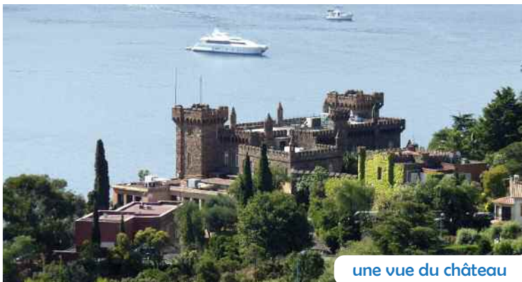
une vue du château