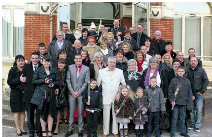
la famille réunie sur le perron de la mairie

Même s'ils se connaissent depuis quelque temps en raison de l'amitié qu'entretiennent leurs parents respectifs, ce n'est qu'au cours de l'été 1949,