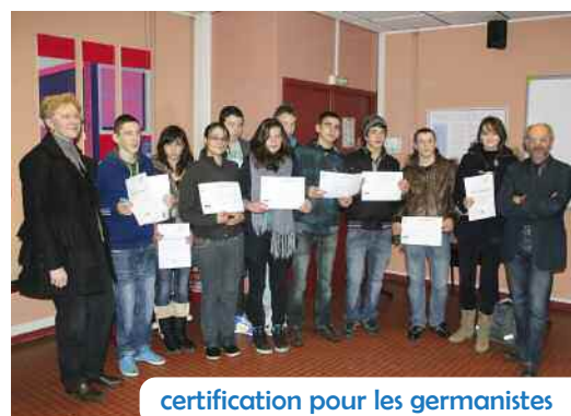
certification pour les germanistes

Une trentaine d'élèves germanistes de 4 ème et 3 ème ont animé les ateliers présentés à ces élèves des écoles primaires de notre ville. Outre un spectacle présenté par les 6 èmes , les animations ont permis aux primaires de découvrir les traditions de Noël germaniques et l'Alle-