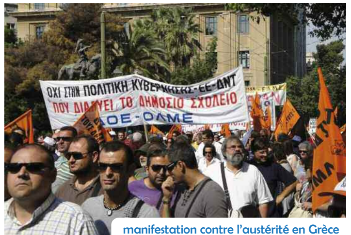
manifestation contre l'austérité en Grèce

Quand je s'rai membre du Medef ; J'aurai pour tâche de foutre en l'air ; Tout c'qui rapporte pas bэфef ; Et qui coûte cher en fonctionnaires ; Et j'me battrais contre la crise ; Pour relancer l'activité ; Je