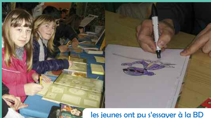
les jeunes ont pu s'essayer à la BD