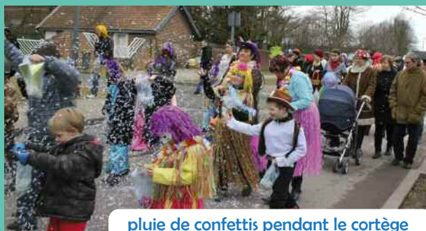
pluie de confettis pendant le cortège

Pour la 4 ème année, les bénévoles de l'association des parents d'élèves des écoles Buisson et Prévert ont organisé un carnaval. Soutenue par le Fonds de participation des Habitants (FPH) et la municipalité, la manifestation a rassemblé une centaine de personnes dont une quarantaine d'enfants. En costume, en perruque et coiffés d'un chapeau, les participants ont déambulé dans la cité 5 en présence du maire Christian Champiré. Revenus à l'école Buisson, les enfants se sont vus offrir un chocolat chaud, des petits pains et des bonbons.