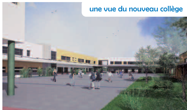
une vue du nouveau collège

D'une durée d'environ 30 mois, ils débuteront cet été. Des réunions auront lieu chaque mois entre les différents partenaires. Celles-ci auront pour objectifs d'informer les riverains et les parents d'élèves sur l'évolution du chantier et de répondre aux questions posées. La construction se déroulera sur deux phases. Le collège bénéficiera de nouveaux locaux adminis-