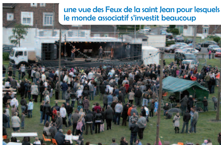
une vue des Feux de la saint Jean pour lesquels le monde associatif s'investit beaucoup

Concernant les dossiers de demande de subventions annuelles ainsi que les demandes exceptionnelles, j'insiste, pour une bonne organisation, afin que chaque responsable d'association respecte le délai du dépôt des dossiers afin que les