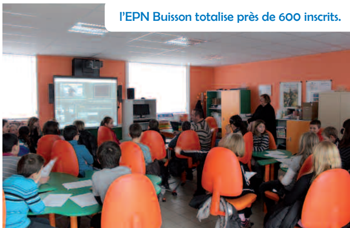
L'EPN Buisson totalise près de 600 inscrits.

L'EPN organise aussi des journées spécifiques autour des consoles de jeux et du jeu en ligne avec le Centre Animation Jeunesse. Hors les murs, grâce à son