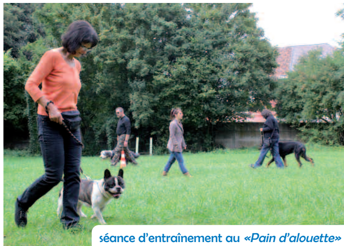
séance d'entraînement au «Pain d'alouette»

En tant que propriétaire d'un chien, nous sommes souvent victimes d'un manque de compréhension vis-à-vis de notre animal de compagnie.