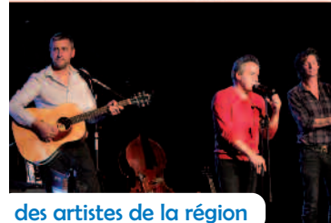
des artistes de la région