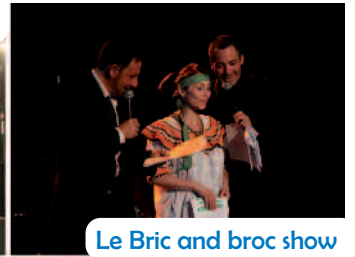
Le Bric and broc show