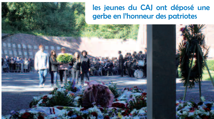
les jeunes du CAJ ont déposé une gerbe en l'honneur des patriotes

Ce sont à ces «combattants de l'ombre» que les représentants de la commune ont voulu rendre hommage. L'occasion également pour plusieurs jeunes du centre d'animation jeunesse de découvrir la citadelle, lieu chargé d'histoire, et de prendre part à une initiative sur le devoir de mémoire.