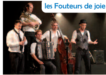
les Fouteurs de joie

Des concerts en l'occurrence avec nos musiciens de l'Harmonie