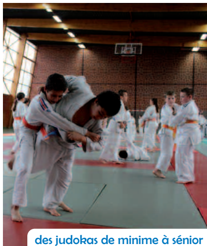
des judokas de minime à sénior

Toute l'année, le club met en place des entraînements à la salle Sakura, rue Louis-Blériot : le mercredi de 17h à 18h (initiation dès 4 ans) ; le mardi et le vendredi de 18h à 19h30 (débutants dès 6 ans) ; le lundi et le mercredi de