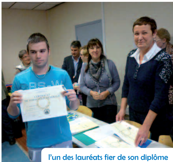
l'un des lauréats fier de son diplôme

Les élèves de la 3 ème d'insertion et ceux de la SEGPA (section d'enseignement général et professionnel adapté) se sont vu remettre quant