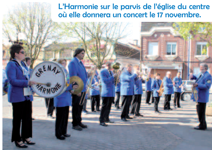
L'Harmonie sur le parvis de l'église du centre où elle donnera un concert le 17 novembre.