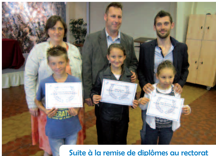
Suite à la remise de diplômes au rectorat

Au cours de plusieurs semaines, élèves et enseignants ont travaillé sur des œuvres littéraires