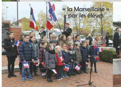
« la Marseillaise » par les élèves