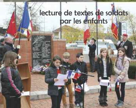
lecture de textes de soldats par les enfants

eux la mémoire de leurs soldats. Des gerbes ont également été déposées au pied du monument de la Première Guerre mondiale devant l'église du Mont-Carmel.