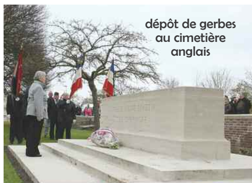
dépôt de gerbes au cimetière anglais

Le cortège s'est déplacé jusqu'au cimetière militaire britannique où nos amis Anglais ont déposé une couronne de coquelicots, les "poppies" symbolisant chez