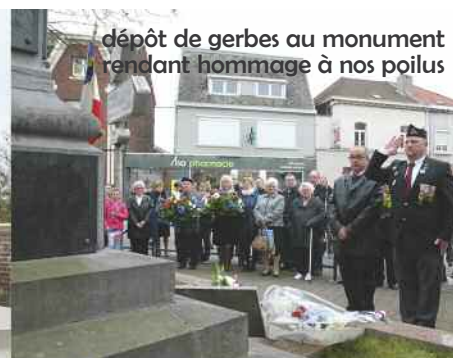
dépôt de gerbes au monument rendant hommage à nos poilus