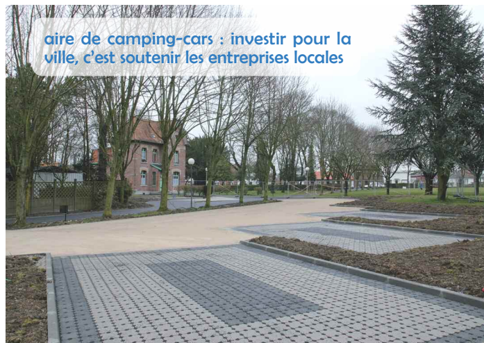
aire de camping-cars : investir pour la ville, c'est soutenir les entreprises locales

indique 40 de fièvre, il ne sert à rien de casser le thermomètre ! Quand il y a déjà 3,5 millions de chômeurs à temps plein et plus de 6 millions de chômeurs en tout c'est que le code du travail n'empêche vraiment pas les licenciements !