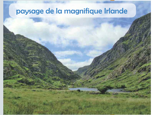
paysage de la magnifique Irlande

Renseignement et réservation au 03 66 54 00 54 .