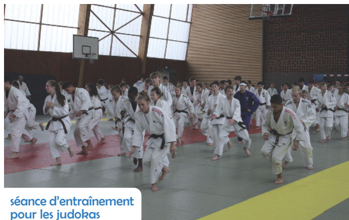
séance d'entraînement pour les judokas

Réservé aux judokas des catégories minimes à seniors, le stage a rassemblé une sélection du club de notre ville, des membres du pôle espoir de Tourcoing et du club de Chilly-