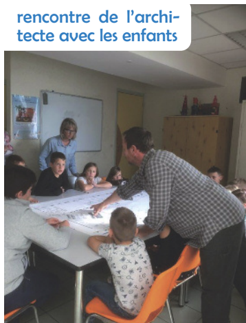
rencontre de l'architecte avec les enfants