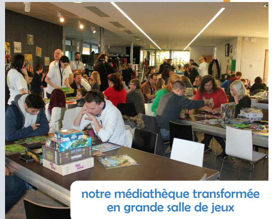
notre médiathèque transformée en grande salle de jeux

Renseignements et réservation au 03 66 54 00 54 .