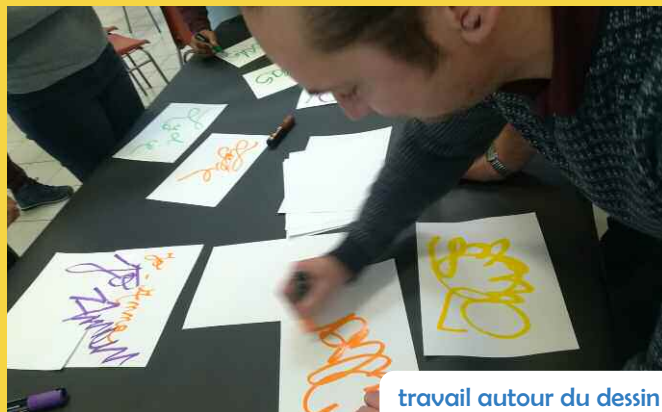
travail autour du dessin

L'occasion aussi pour elle d'offrir quelques cadeaux dont un jeu spécialement créé afin de découvrir Grenay et de se retrouver pour le verre de l'amitié organisé par la ville.