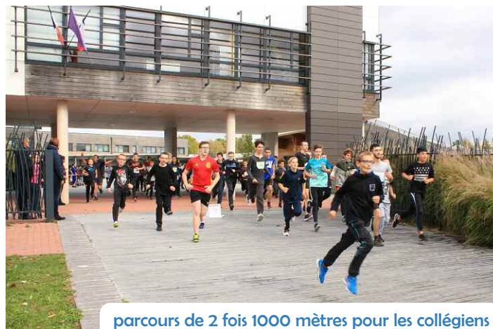
parcours de 2 fois 1000 mètres pour les collégiens

Soutenue par la municipalité et les commerçants de la ville notamment pour les lots offerts, l'action a également bénéficié de l'aide des représentants départementaux de l'UNSS (Union Nationale du