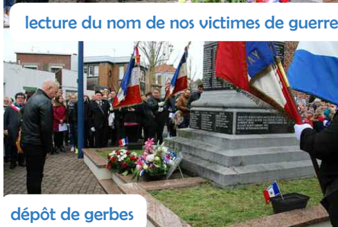
lecture du nom de nos victimes de guerre