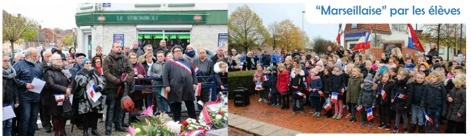
"Marseillaise" par les élèves

Lors du défilé, les enfants, leurs parents et leurs enseignants, ont pu agiter les drapeaux offerts par la ville. Les présents ont pu également apprécier les décorations à nos couleurs et à celles de nos communes jumelées ainsi que celles installées par les habitants sur les façades de leur maison à l'invitation de la municipalité.