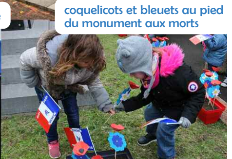
coquelicots et bleuets au pied du monument aux morts