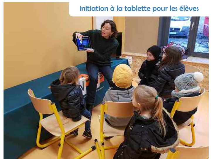
initiation à la tablette pour les élèves

A noter que, dans le cadre de l'édition 2019 des "Chantiers d'été", des fresques seront réalisées sur les murs intérieurs du bâtiment.