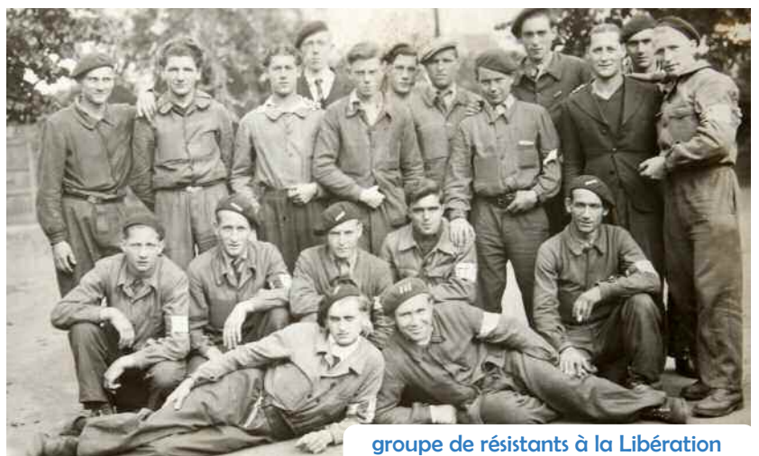
groupe de résistants à la Libération

Si vous possédez des archives en rapport avec la Résistance ou des cartes postales datant à peu près de cette époque, n'hésitez pas à contacter l'auteur. Vous pouvez aussi vous rapprocher de Grégory Picart pour réserver votre ou vos exemplaires avant la publication afin de pouvoir bénéficier d'un tarif réduit grâce à la souscription. Rens. au 06 74 53 80 75.