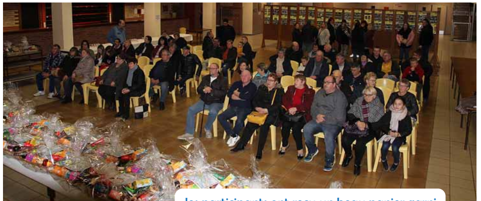
les participants ont reçu un beau panier garni