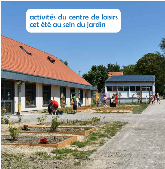
activités du centre de loisirs cet été au sein du jardin