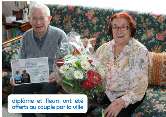
diplôme et fleurs ont été offerts au couple par la ville

C'est à Bully, dans un dancing, que le couple se rencontre. C'est le coup de foudre ou