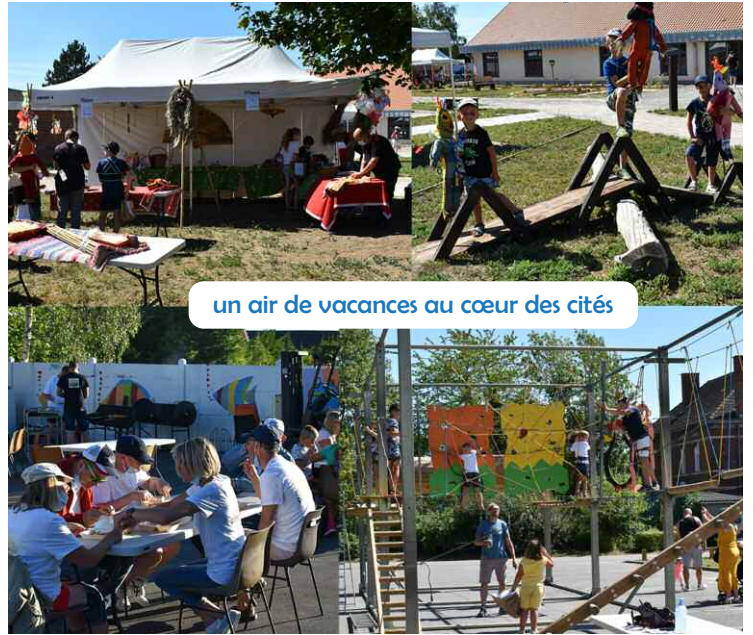
un air de vacances au cœur des cités