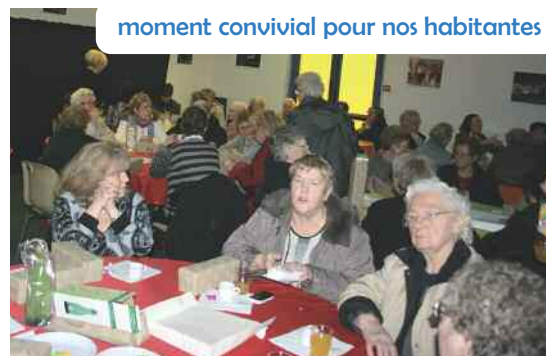
moment convivial pour nos habitantes