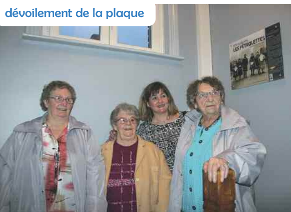
dévoilement de la plaque