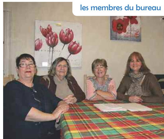
les membres du bureau

Renseignement au 06 62 79 79 30 ou au 06 73 63 12 70.