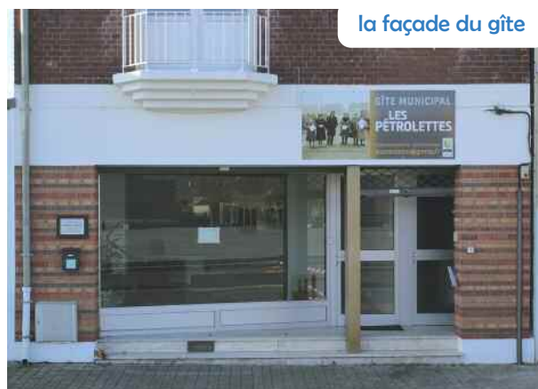
la façade du gîte

Découvrez des photos de l'intérieur du gîte sur le site de la ville au menu « tourisme ». Pour plus de renseignements ou pouvoir réserver, il vous est possible d'envoyer un message à lespetrolettes@grenay.fr ou appeler en mairie au 03 21 72 66 88.