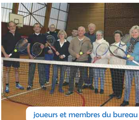
joueurs et membres du bureau

Le club est ouvert à tous. Une école accueillant déjà des enfants âgés de 6 ans est accessible également aux adolescents et