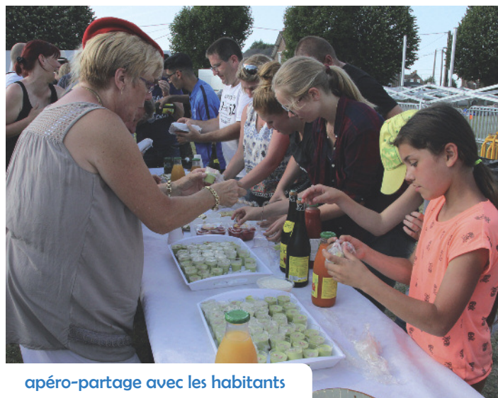
apéro-partage avec les habitants