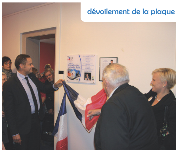
dévoilement de la plaque

Venu-e-s nombreux, les habitant-e-s ont pu découvrir le nouveau local qui a été entièrement renoué grâce au travail remarquable des agents des services techniques. Les personnes présentes ont également pu découvrir les superbes fresques réalisées par les jeunes des « Chantiers