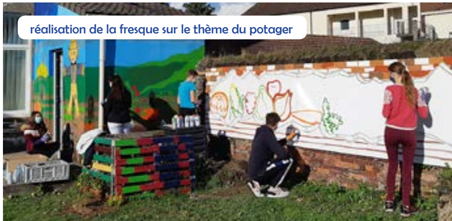
réalisation de la fresque sur le thème du potager

petits groupes de jeunes. Le travail s'est déroulé en trois temps, en septembre, à la Toussaint et au cours d'un atelier qui vient de s'achever. Soutenue par le grapheur Maxime, l'action devrait se poursuivre l'an prochain.