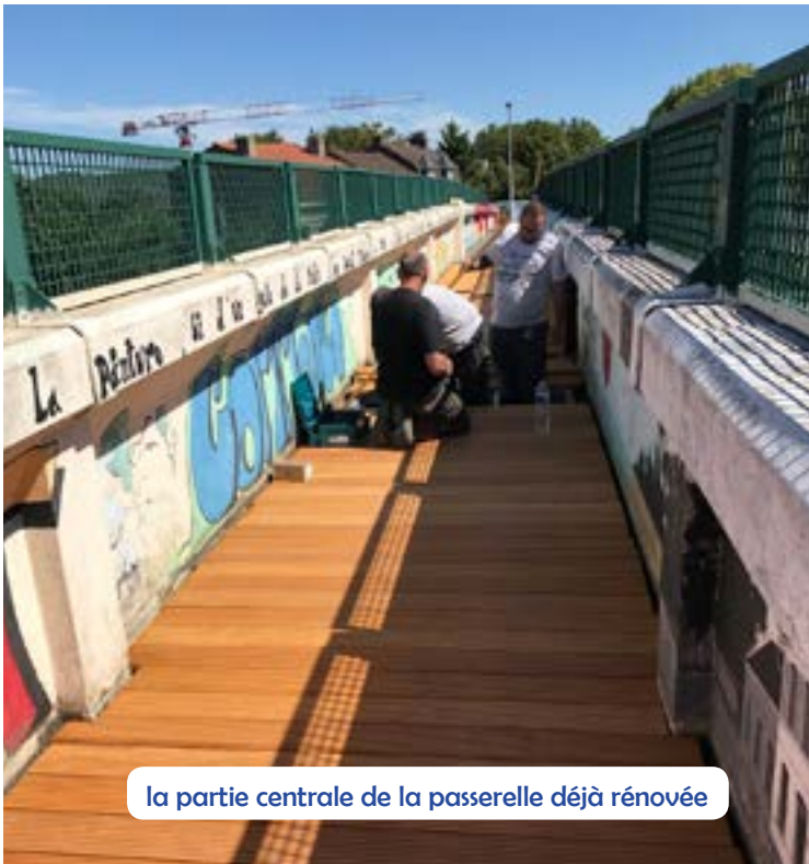
la partie centrale de la passerelle déjà rénovée

Dans le cadre de la rénovation de la passerelle entre Grenay et Bully-les-Mines, afin de la sécuriser, les services techniques municipaux ont déjà posé le revêtement bois de la partie haute et des rampes du côté de notre ville. Les soubassements métalliques ont été réalisés aux services techniques par