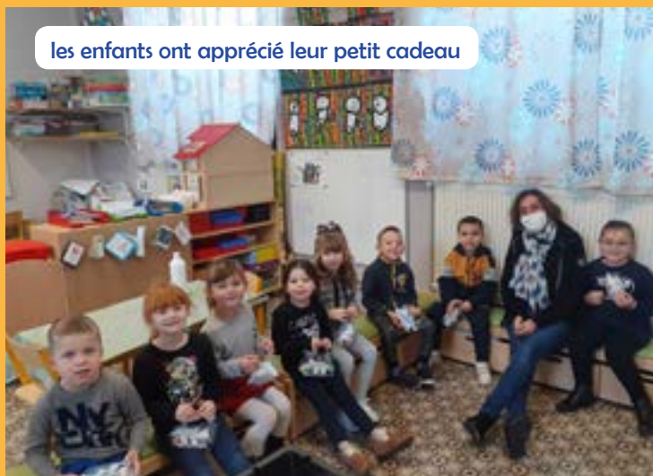
les enfants ont apprécié leur petit cadeau

Les élu-e-s repasseront pour les fêtes de Noël pour offrir des chocolats et de coquilles pour tous les élèves dont ceux du collège.