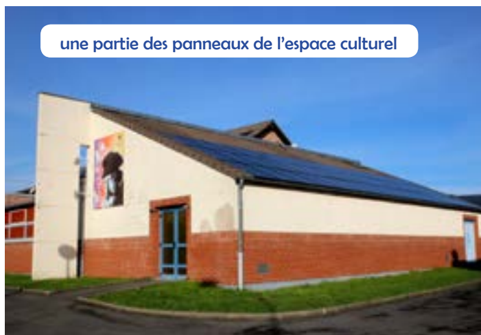
une partie des panneaux de l'espace culturel

La municipalité poursuit sa démarche écologique en s'investissant plus que jamais dans l'énergie verte. Suite à des travaux réalisés de mars à septembre, la mise en service de la production d'électricité a eu lieu dès le 9 octobre. L'opération d'autoconsommation collective a débuté le 7 novembre, ce qui permet l'approvisionnement des écoles Prévert et Buisson-Lacore, de l'espace culturel, du bâtiment Suzanne-Lacore, de la salle Bigotte, des services techniques, de la salle Fasquel et des deux maisons de quartier près de l'église Saint-Louis. Dans une première