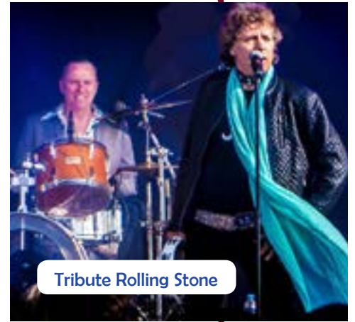
Tribute Rolling Stone