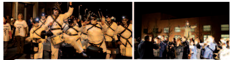
la spectacle a eu lieu place D.Breton et devant le Louvre-Lens

Plus tard, devant le musée Louvre-Lens, les bénévoles de l'Harmonie de notre ville et les habitants de Grenay, Avion, Billy-Montigny et