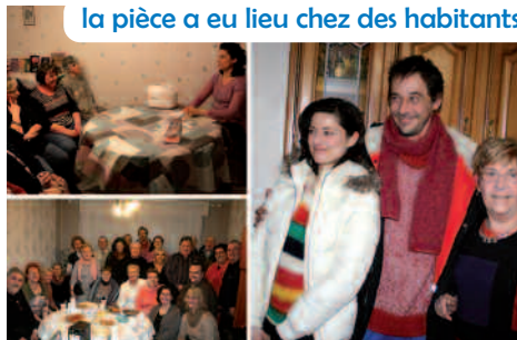
la pièce a eu lieu chez des habitants

Somme de témoignages récoltés auprès de Grenaysiens mais également travail de création, le texte est clair, intelligent, homogène rendant compte d'une vraie réalité. Le spectacle fait réagir et rire le public parce qu'il lui permet de se re-