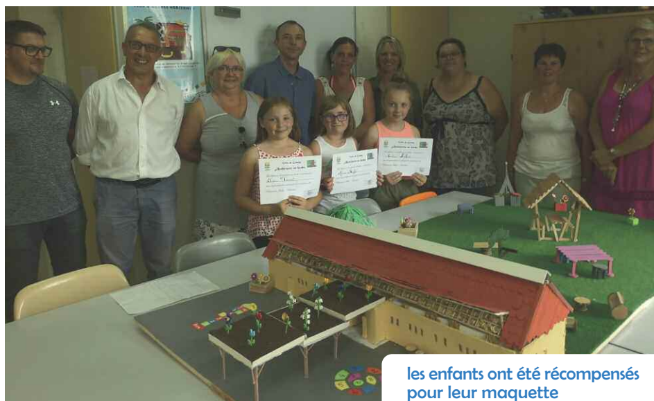
les enfants ont été récompensés pour leur maquette

L'architecte est revenu avec un bout de mur et les enfants se sont amusés à faire un enduit avec de la terre. Ils ont imaginé le jardin avec des fleurs et des bancs en bois, le préau avec des fleurs au-dessus, la cour avec des jeux. Pour la toiture, ils ont fabriqué des caissons avec de la paille dedans qu'ils ont recouvert de tuiles.