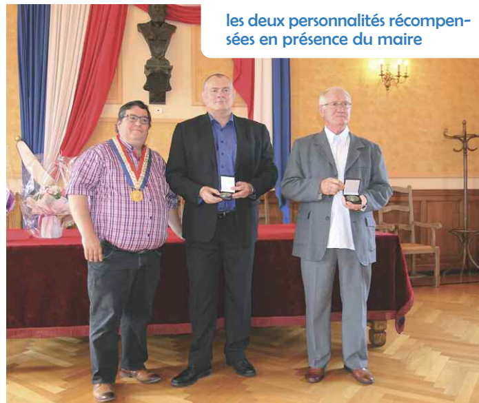
les deux personnalités récompensées en présence du maire