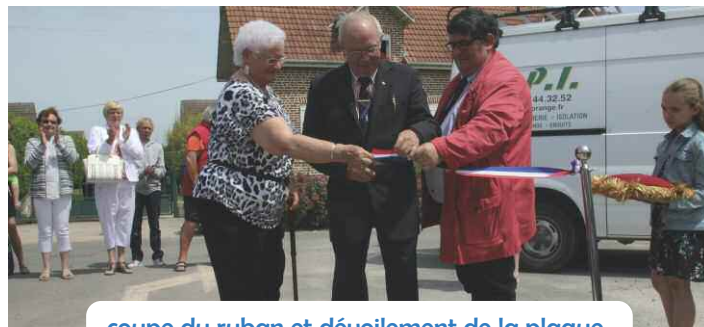
coupe du ruban et dévoilement de la plaque

Le maire a rappelé que l'ancienne salle avait été construite à la fin des années 70 par un ensemble de bénévoles dont d'anciens mineurs. La nouvelle structure a été réalisée quasiment en totalité par les agents des services techniques municipaux qui ont