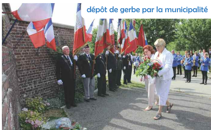
dépôt de gerbe par la municipalité

Afin de respecter la mémoire de nos résistants morts ou ayant risqué leur vie pour nous, une délégation s'est déplacée à Aizecourt-le-Bas, un petit village de la Somme. Le 28 juin 1944, un groupe de Francs-Tireurs et Partisans (F.T.P.) y avait essayé l'attaque de l'occupant et de ses complices.