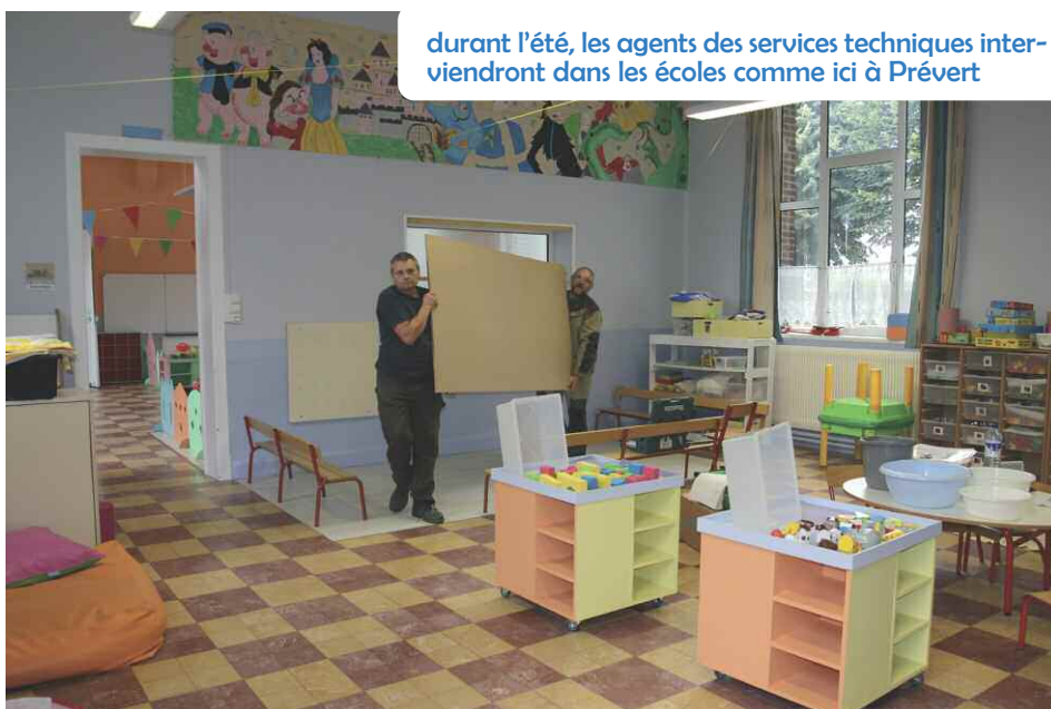
durant l'été, les agents des services techniques interviendront dans les écoles comme ici à Prévert

Le dernier changement programmé pour cette rentrée est le regroupement des enfants des écoles Marcel-Morieux et