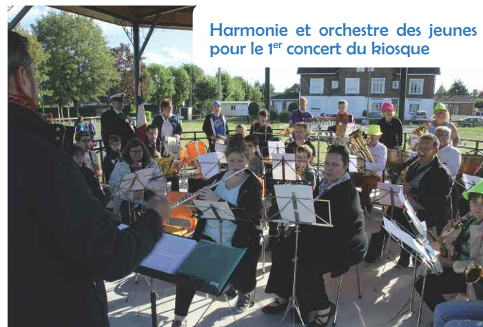
Harmonie et orchestre des jeunes pour le 1 er concert du kiosque

pas en rester là. Toujours suivant le souhait des habitants, la ville a construit un kiosque afin que chacun puisse jouer et entendre jouer de la musique.