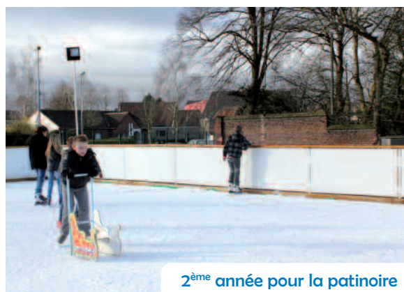
2 ème année pour la patinoire