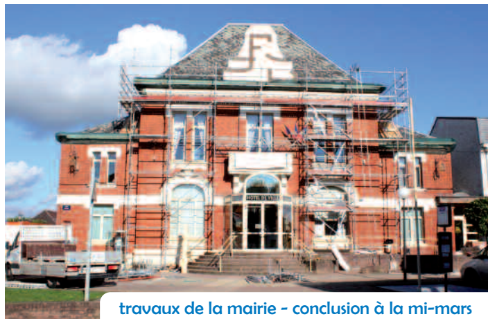
travaux de la mairie - conclusion à la mi-mars

Non, nous arrivons à financer nos investissements grâce à trois éléments : les économies que nous réalisons sur tous les postes dans le budget de fonctionnement, les chefs de service et les services jouent le jeu et je les en remercie très vivement car ils font des miracles à chaque fois en faisant plus avec moins et en allant chercher toutes les subventions possibles et imaginables. Ces économies sont transformées en autofinancement pour