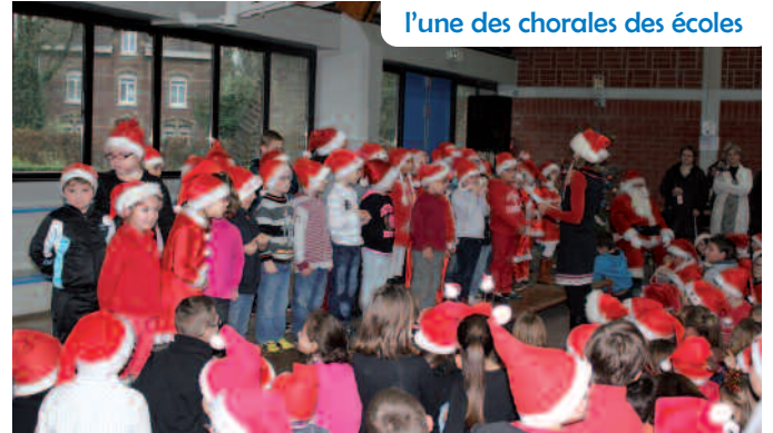
l'une des chorales des écoles

Votre journal reviendra dans son prochain numéro sur les autres arbres et marchés de Noël organisés pendant les fêtes.