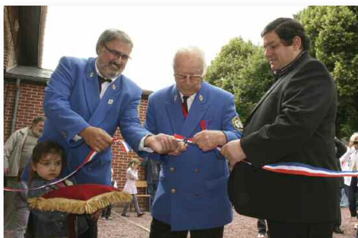
Au moment de la coupe du ruban, geste symbolisant l'inauguration de la nouvelle école de musique.

Dans la cité 11, rue du Cambodge, un espace était