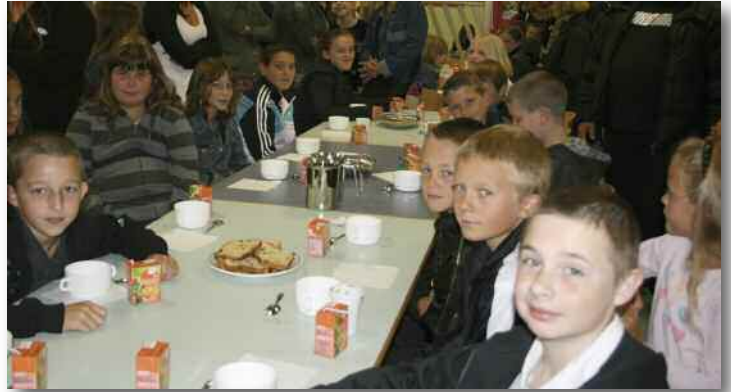
Rentrée scolaire pour les 6 ème dans une ambiance conviviale.

Lors de cette journée, les collégiens ont aussi reçu leurs manuels pour l'année ainsi que des fournitures scolaires financées