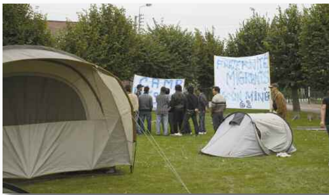
Les migrants ont campé durant deux jours devant la mairie d'Angres.

Puis, la peur au ventre, ils sont repartis s'installer ailleurs près de l'autoroute. Leur ancien campement brûlé, ils sont dans la misère, le plus grand dénuement. "Fraternité Migrants" les aide mais la