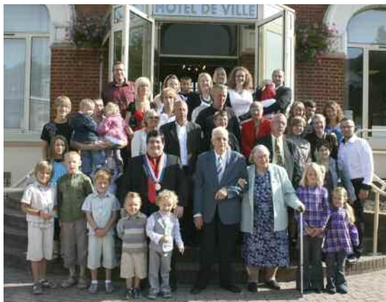
Photo souvenir sur le perron de la mairie.