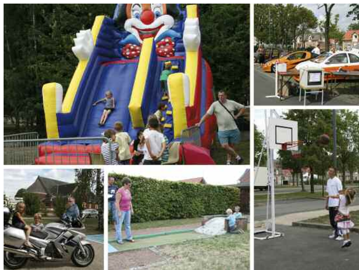
Deuxième édition réussie pour les "Quartiers d'été".

Le point d'orgue de la manifestation a eu lieu le samedi 31 juillet. L'après-midi, les abords de l'église Saint Louis se sont animés. De multiples stands