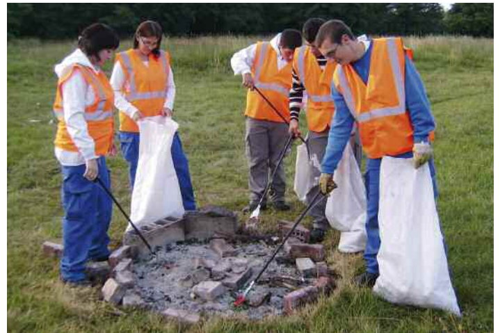
Les jeunes ont contribué à rendre propre la commune.

Dans le cadre de ce chantier, ce public a bénéficié d'un atelier consacré à la recherche d'un emploi ou d'un stage de deux heures de sensibilisation à