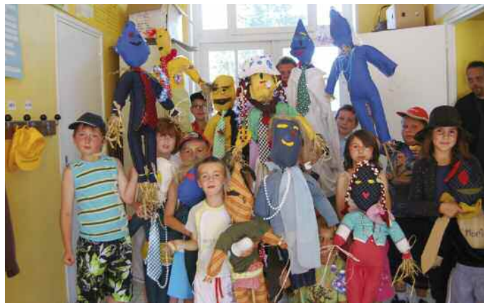
Atelier marionnettes pour les enfants.