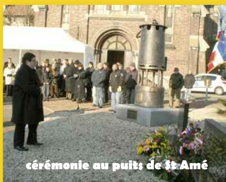
cérémonie au puits de St-Amé