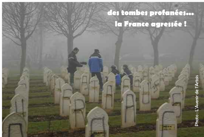
des tombes profanées... la France agressée !

En voulant séparer ceux qui ont été unis dans les combats, dans la boue, dans les tranchées, dans la mort, les criminels qui s'en sont pris aux tombes de Notre Dame de Lorette en voulaient à la République Française, à notre République et à ses valeurs de tolérance.