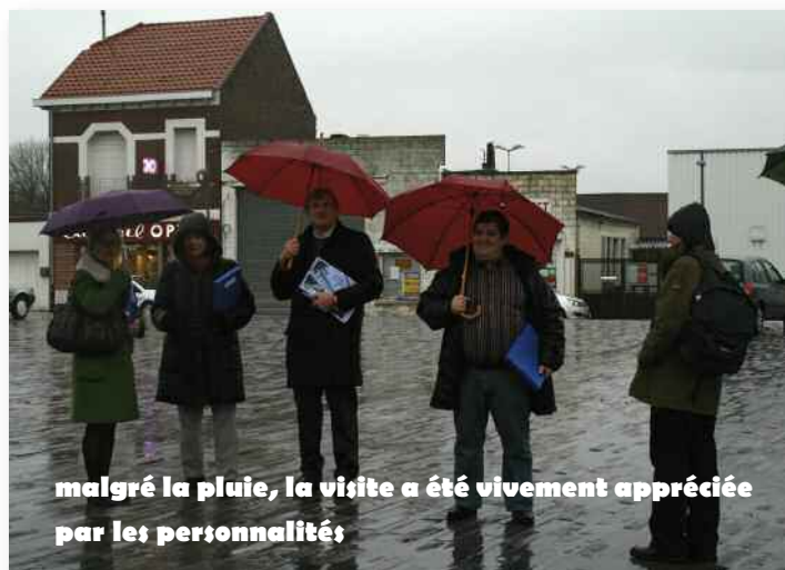
malgré la pluie, la visite a été vivement appréciée par les personnalités