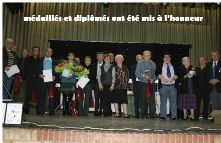
médaillés et diplômés ont été mis à l'honneur

Enfin, les médailles argent-vermeil-or ont été décernées à