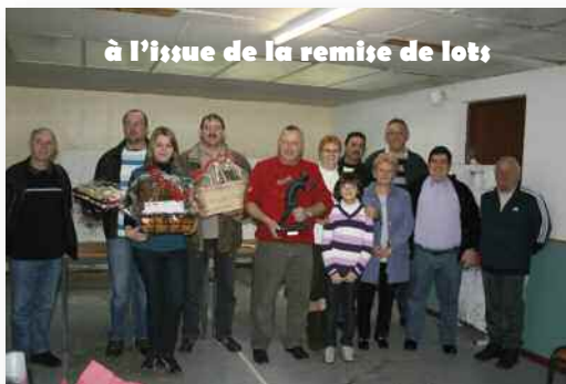
à l'issue de la remise de lots

Le club s'est aussi distingué lors de l'entente, compétition amicale avec les clubs de Mazingarbe et Vermelles. En peloton de 5 joueurs, l'équipe A de Grenay est arrivée à la