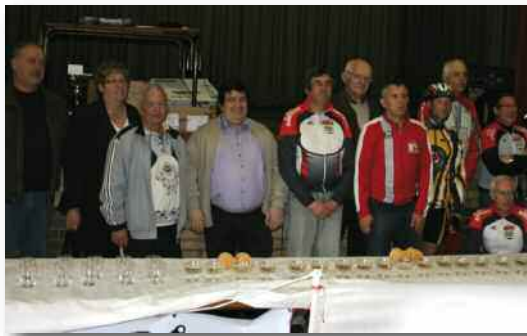
Remise des coupes à l'issue de l'un des plus grands brevets du Pas-de-Calais.

Record battu ! Grâce à une journée démente et à la mobilisation des nombreux bénévoles, le dernier brevet du club n'a jamais été aussi populaire. Près de 600 inscrits sur les parcours route, plus de 300 vététistes et une cinquantaine de marcheurs sont venus passer une matinée sous le signe de