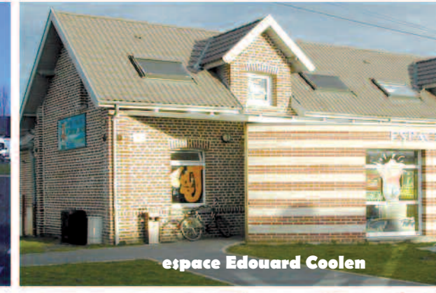
espace Edouard Coolen