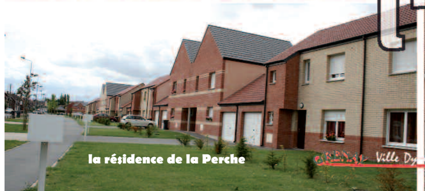
la résidence de la Perche