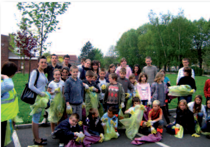
Les jeunes au départ de l'action équipés de sacs poubelles.

Orchestré par le service Jeunesse et plus particulièrement par le Point Information Jeunesse, nos jeunes apprentis citoyens en herbe ont pu ainsi, équipés de gants et de sacs poubelles jaunes et bordeaux, ramasser tous les détritiques aux abords du service jeunesse, du mini golf, de l'église Saint Louis, de la place et du boulevard du même nom, du stade de football jusqu'à la salle Mercier.