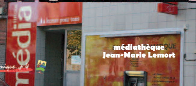
médiathèque Jean-Marie Lemort