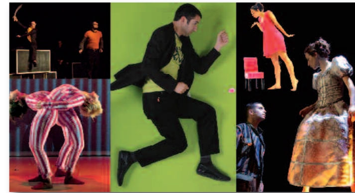
Des spectacles pour petits et grands.

Entre récits du quotidien et imaginaire collectif, contes fantastiques et légendes urbaines, « Cité Babel » raconte les habitants du quartier de la Lionderie (Hem) face à leur destin commun, à leurs renoncements