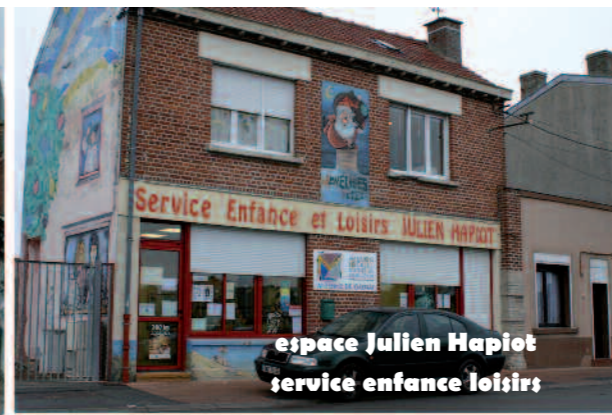
espace Julien Hapiot service enfance loisirs