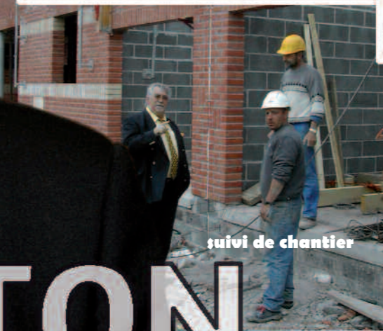
suivi de chantier