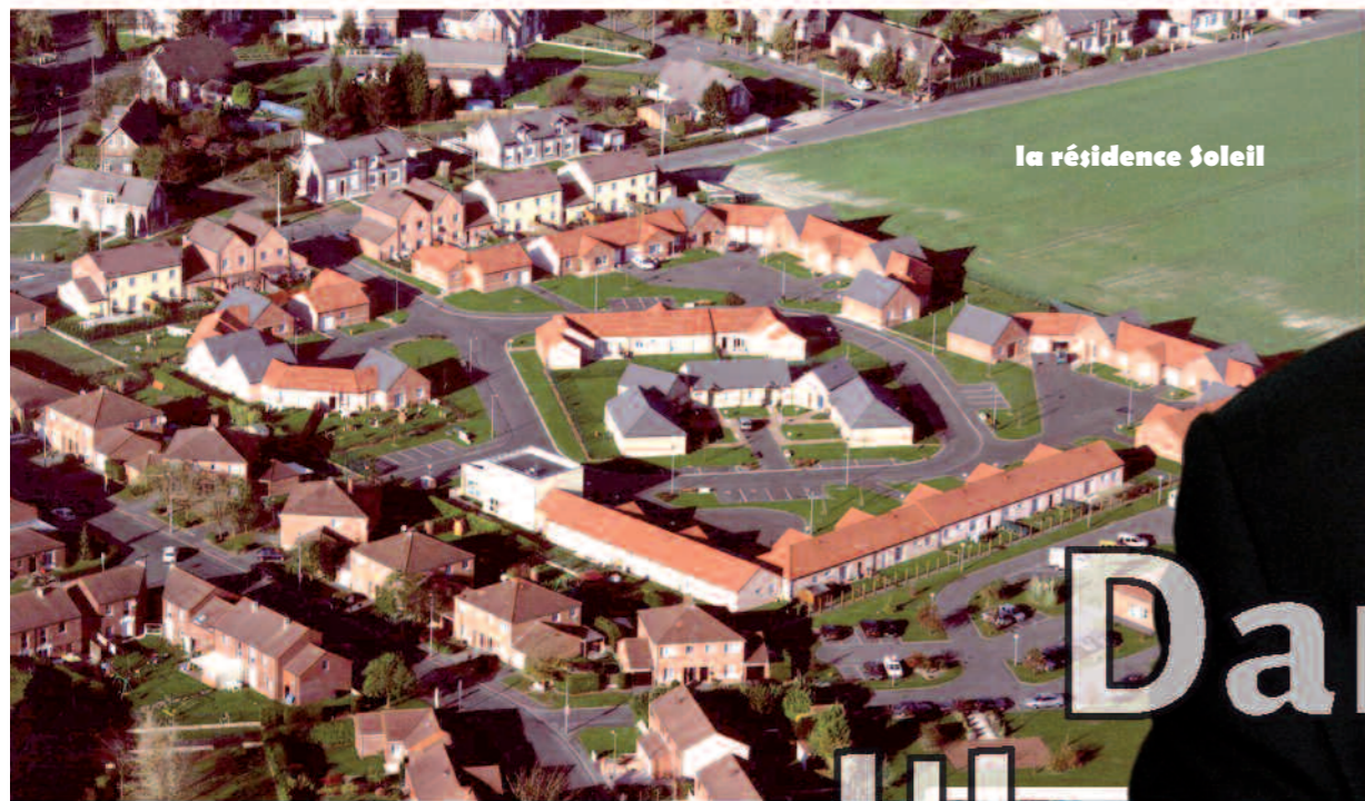
la résidence soleil