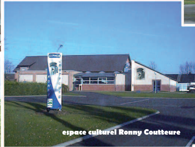
espace culturel Ronny Coutteure