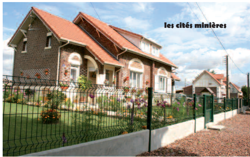
les cités minières