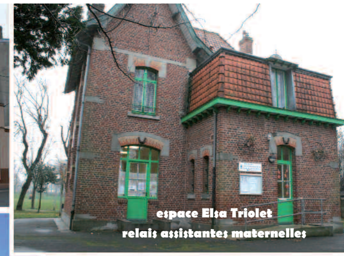
espace Elsa Triolet relais assistantes maternelles