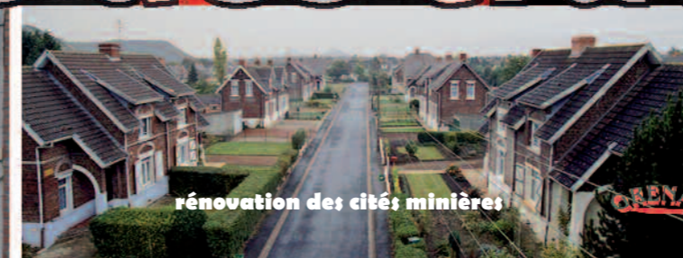
renovation des cités minières