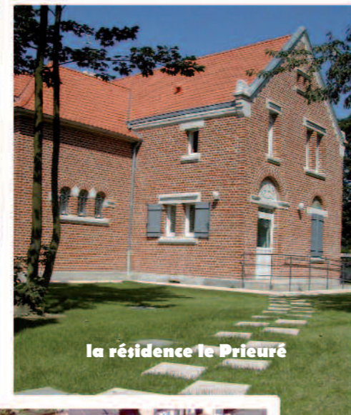
la résidence le Prieuré