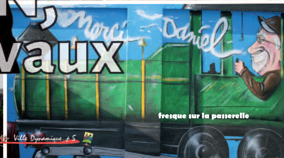
fresque sur la passerelle