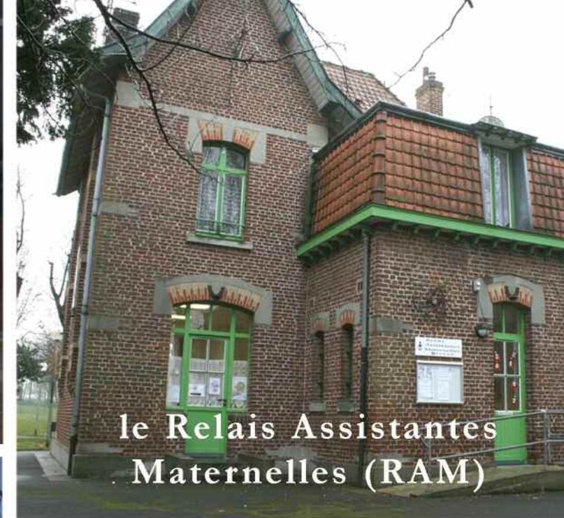
le Relais Assistantes Maternelles (RAM)