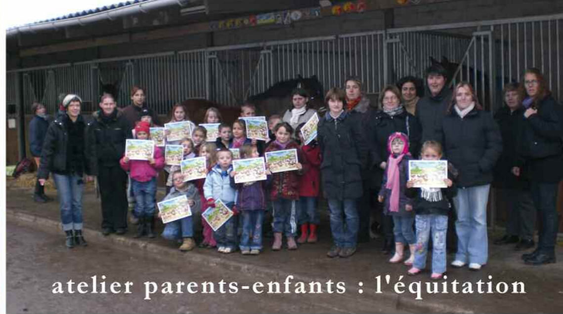
atelier parents-enfants : l'équitation