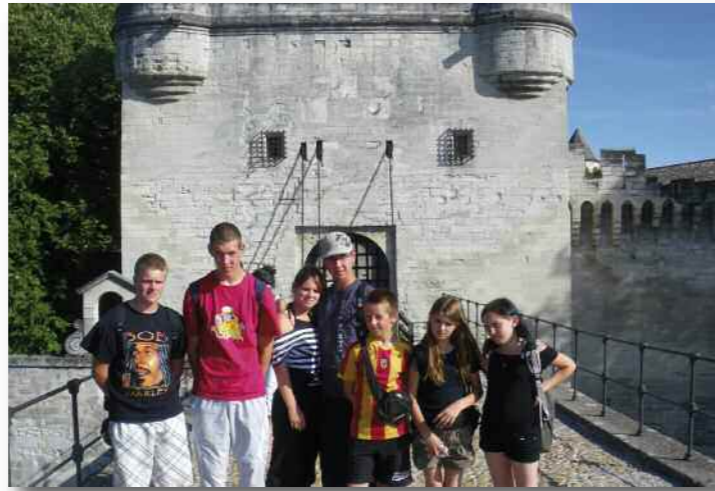
Les jeunes sur le légendaire pont d'Avignon.

financièrement par la municipalité, le Conseil Régional dans le cadre de la politique ville et l'association "Jeunes dans ma ville". Le voyage a