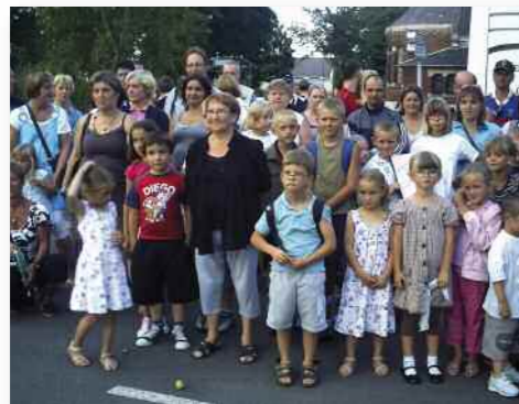
Lors du rassemblement pour le départ vers le sud de la France.

vivre à Grenay» et est soutenu financièrement par la Caisse d'Allocations Familiales d'Arras, le Conseil Général du Pas-de-Calais, le Réseau d'Aide et d'Accompagnement à la Parentalité (REAAP), Vacances Ouvertes, le Fonds de Participation des Habitants (FPH) et les familles.