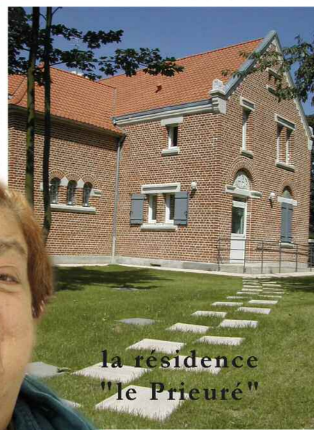
la résidence "le Prieuré"