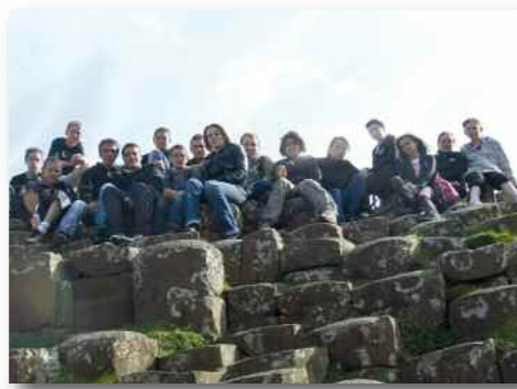
Les jeunes du CAJ en visite sur la chaussée des Géants.

Dans le Donegal, et plus particulièrement à Ballyshannon, ville jumelée avec Grenay, les jeunes du C.A.J ont assisté au festival de musique traditionnelle. Parmi les invités de cette 32 ème édition, les Grenaysiens ont apprécié le talent du groupe Altan. Dans cette région, la plupart des adolescents ont gravi les Slieve League, les falaises les plus hautes d'Europe dont le sommet culmine à 601 mètres de