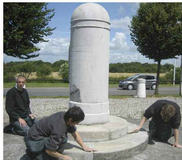
Parmi les tâches, le nettoyage du monument de l'arbre de Condé. l'égalité des chances) Conseil Régional et la ville dans le cadre du CUCS, le de Grenay.

Cette action est financée par l'ACSE (agence nationale pour la cohésion Sociale et