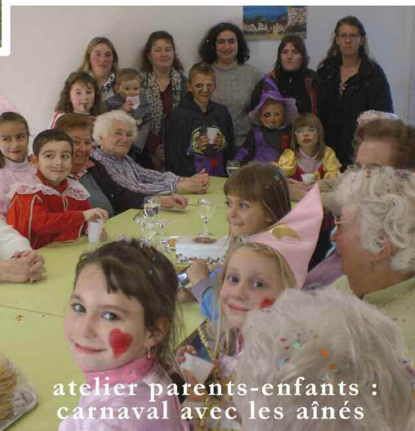
atelier parents-enfants : carnaval avec les aînés