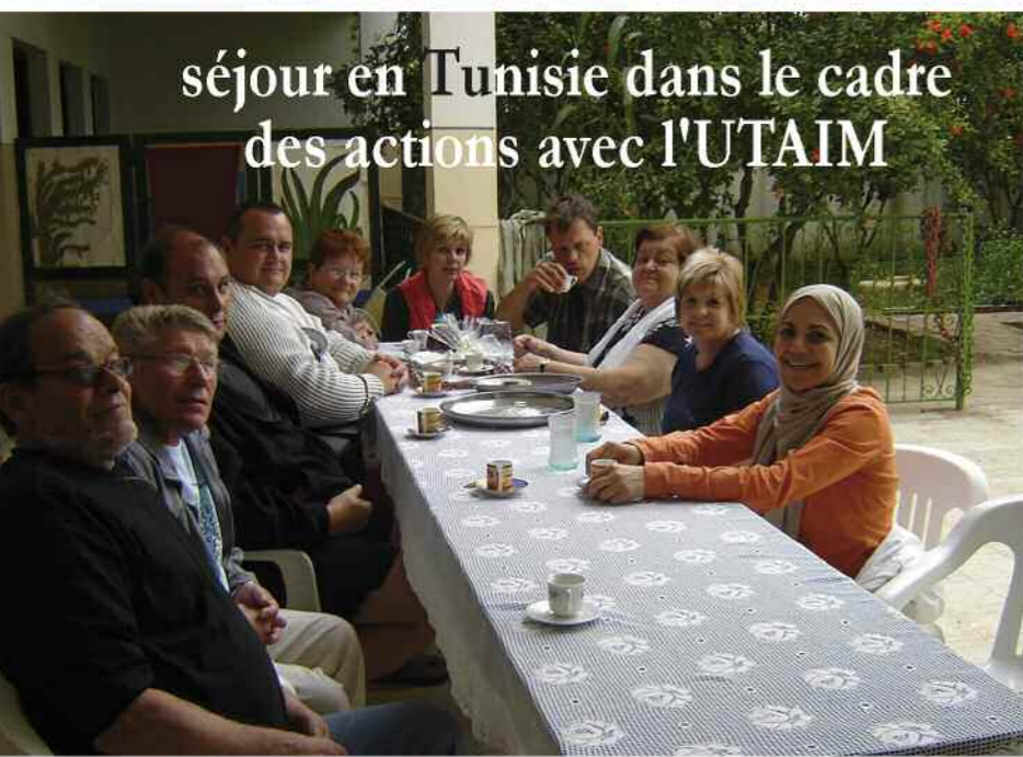
séjour en Tunisie dans le cadre des actions avec l'UTAIM