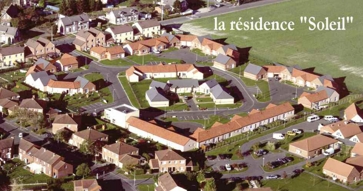
la résidence "Soleil"