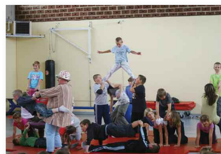
Exercices d'acrobaties pour les enfants à la salle Fasquel. Renseignements auprès du Service Enfance et Loisirs (SEL) au 03 21 72 03 04 .

Très réussie, la kermesse s'est déroulée sous un temps très agréable en présence de nombreux parents. Rendez-