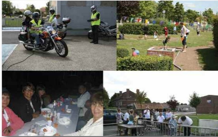
Ensemble, la municipalité, les habitants et les bénévoles d'associations locales ont redonné vie aux "Quartiers d'été".

Pour clore cette journée festive, une projection était organisée en plein air sur écran géant. Le 1 er film « Bienvenue à Grenay » a remporté un vif succès auprès des 450 spectateurs présents. Ce court métrage a été réalisé par six jeunes participant à l'atelier vidéo du CAJ, en partenariat avec l'association Hors Cadre, dans le