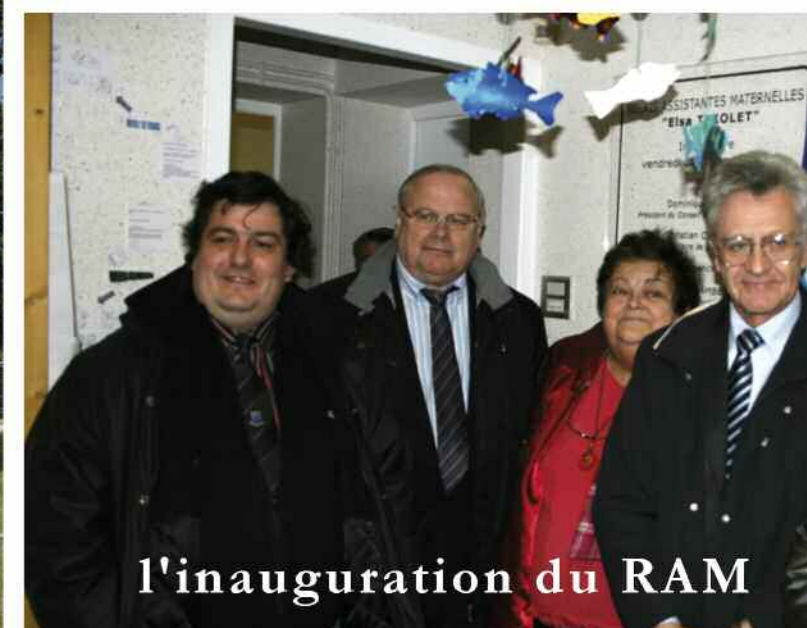
l'inauguration du RAM