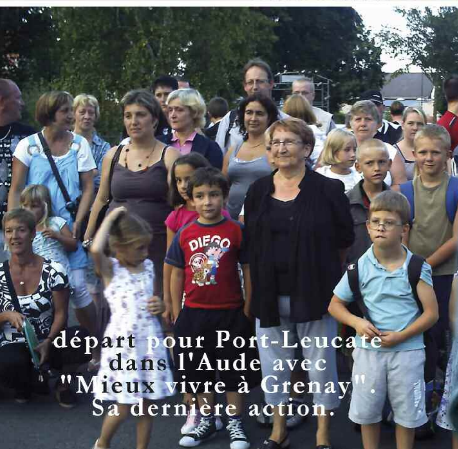
départ pour Port-Leucate dans l'Aude avec "Mieux vivre à Grenay". Sa dernière action.