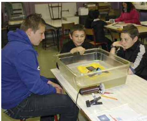
Les élèves des écoles primaires ont pu participer à de nombreuses expériences.

Au total, onze ateliers ont été préparés par les collégiens de 3 ème aidés de leurs professeurs. Animés par ces derniers, les ateliers ont permis à des élèves en binôme de 6 ème -CM2 de prendre part à des expériences très diffé-