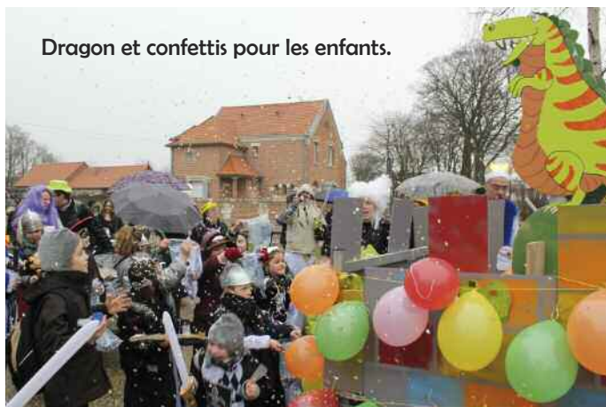
Dragon et confettis pour les enfants.