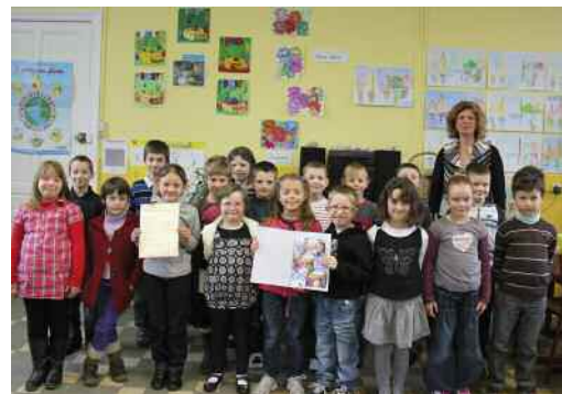
Les élèves et leur institutrice, heureux de nous montrer le travail pour lequel ils ont eu un prix national.

Une remise de prix a eu lieu à l'école Rostand. Sur 30 prix, les élèves ont reçu le 4 ème , ce qui leur a permis de recevoir des cadeaux.