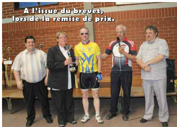
A l'issue du brevet, lors de la remise de prix.