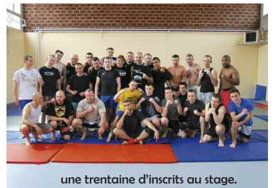
une trentaine d'inscrits au stage.