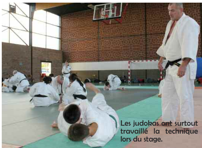
Les judokas ont surtout travaillé la technique lors du stage.

Stage préparatoire à l'occasion des débuts de la saison sportive, le stage a été encadré par une dizaine de professeurs qui ont accueilli des athlètes venus, entre autres, de Wingles, Wasquehal ou Gonfreville l'Orcher près du Havre.