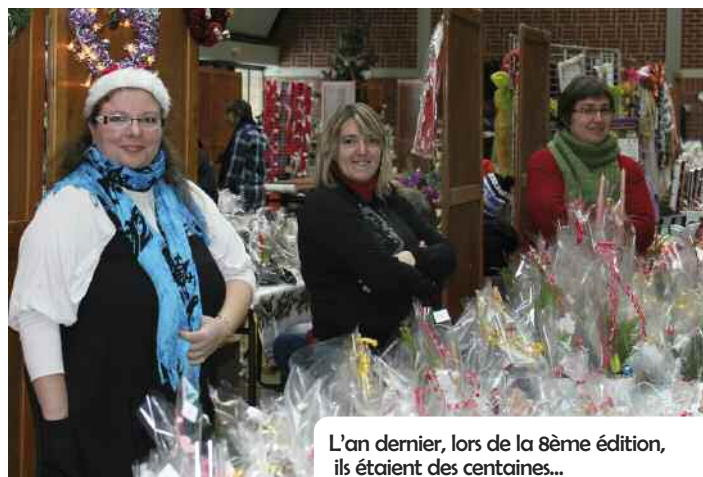
L'an dernier, lors de la 8ème édition, ils étaient des centaines...

Côté animation, riches seront les prestations seront proposées : une ambiance musicale sur le thème de Noël, des flocons de neige, une projection laser gra-