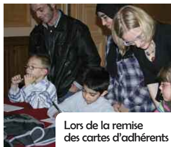
Lors de la remise des cartes d'adhérents

Après une 1 ère expérience bénéfique pour les enfants, l'école Bince et la ville ont choisi de s'inscrire à nouveau dans cette dynamique, le pilotage étant assuré par la coordinatrice du PRE, en collaboration avec