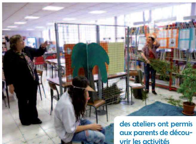
des ateliers ont permis aux parents de découvrir les activités

Les responsables et les enseignants du collège Langevin-Wallon ont mis en place pour la 2 ème année consécutive une journée portes-ouvertes. Destinée aux élèves de CM2 jusqu'à la 3 ème ainsi qu'à leur famille, la manifestation leur a permis de découvrir l'établissement. De nombreuses activités avaient été mises en place à cette occasion.