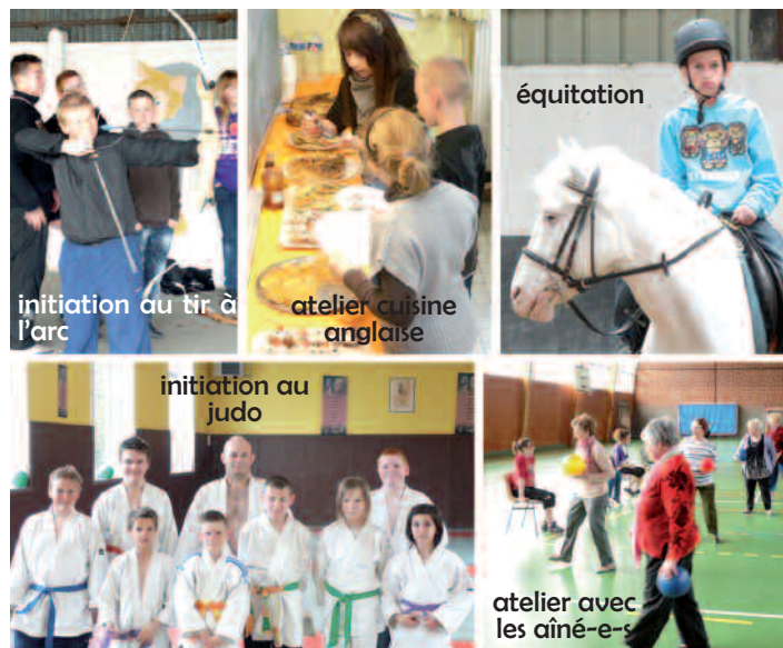
initiation au tir à l'arc

Autrement, en partenariat avec le CCAS, ils ont participé à l'atelier mémoire et gym douce aux côtés de nos aîné-e-s. Inscrits à l'atelier vidéo, certains d'entre eux ont aussi filmé les deux co-