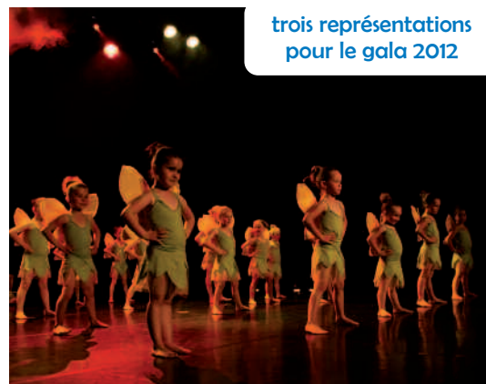
trois représentations pour le gala 2012

Découvrez le site de l'association sur http://www.facebook.com/jazzpointe