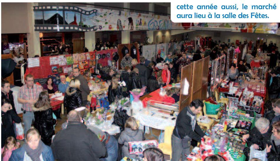
cette année aussi, le marché aura lieu à la salle des Fêtes.

Côté restauration, les organisateurs vous