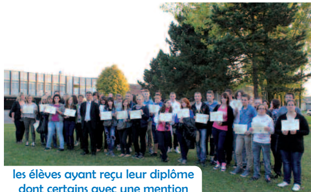
les élèves ayant reçu leur diplôme dont certains avec une mention

Concernant les CFG, le taux de réussite est de 89% cette année soit 24 admis.