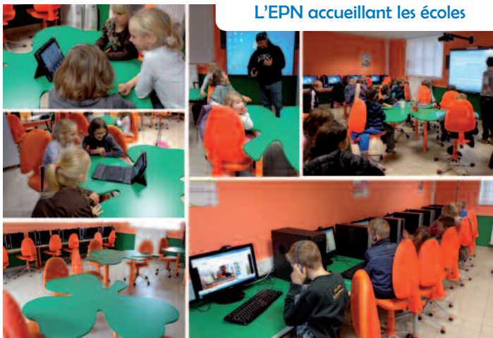
L'EPN accueillant les écoles