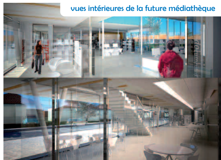
vues intérieures de la future médiathèque