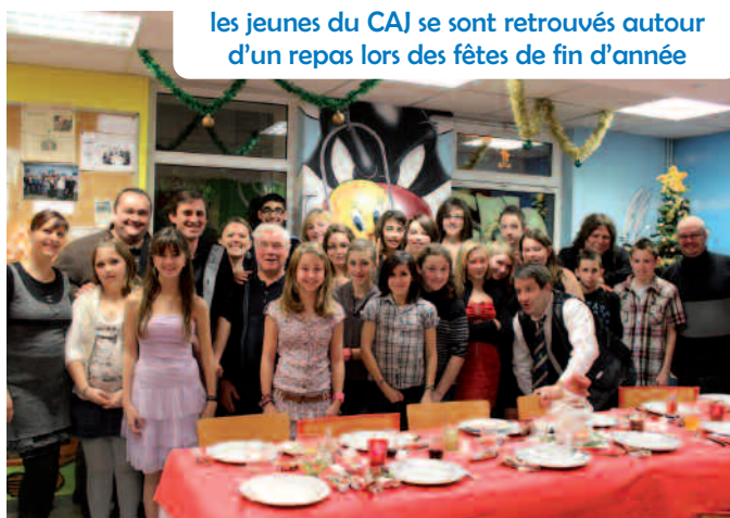
les jeunes du CAJ se sont retrouvés autour d'un repas lors des fêtes de fin d'année

Comme il est de tradition maintenant, les jeunes ont terminé l'année par un repas festif à l'espace Coolen. Ils ont tous mis la main à la pâte pour concocter un bon repas comme il se doit et préparer