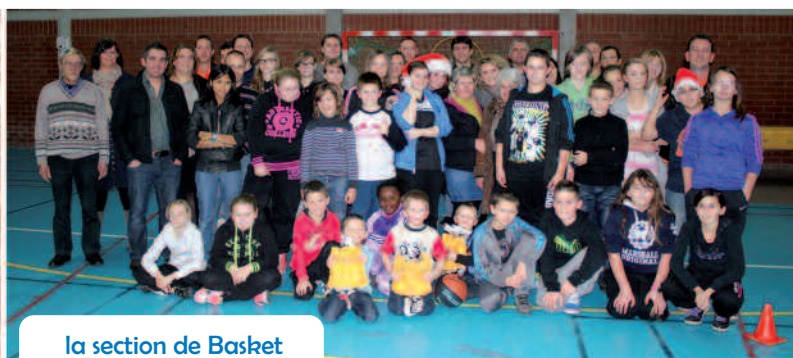
la section de Basket