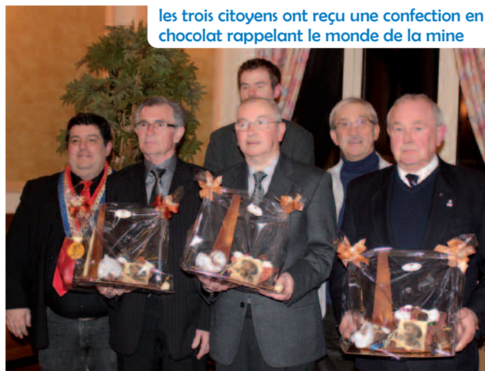
les trois citoyens ont reçu une confection en chocolat rappelant le monde de la mine

Lorsque la catastrophe du 27 décembre 1974 a lieu à Liévin, il est chez lui en attendant de prendre son poste à midi. Sa femme entend à la radio qu'un accident y a eu lieu. Comme d'habitude, il se prépare pour aller travailler. A la fosse 3 de Liévin, on lui confirme que des explosions