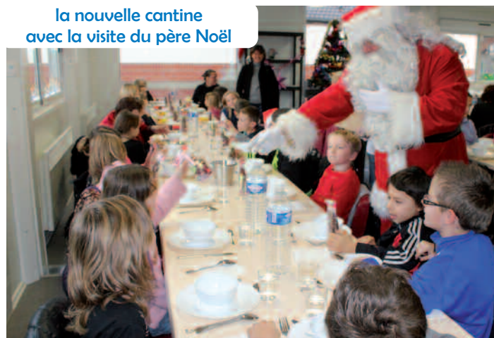
la nouvelle cantine avec la visite du père Noël