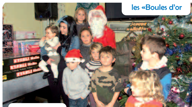
le club Mercier