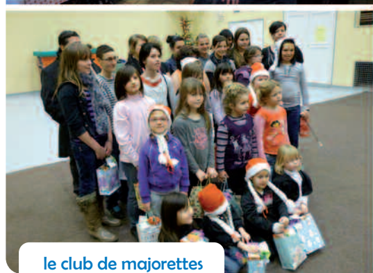
le club de majorettes