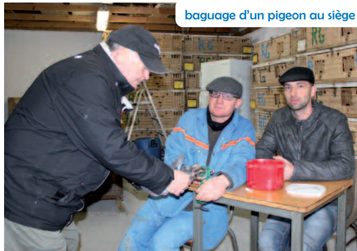
baguage d'un pigeon au siège

Actuellement, nous sommes une cinquantaine de sociétés. Chaque année, nous organisons des concours qui se déroulent du 1 er avril au 15 août. Les épreuves sont classées notamment en catégorie vitesse, jusqu'à 250 km à parcourir pour le pigeon, et en demi-fond, de 250 à 400 km. Dès novembre, nous mettons en place les expositions partielles lors desquelles des