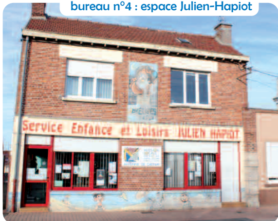
bureau n°4 : espace Julien-Hapiot

LES BUREAUX DE VOTE SONT OUVERTS DE 8H À 18H.