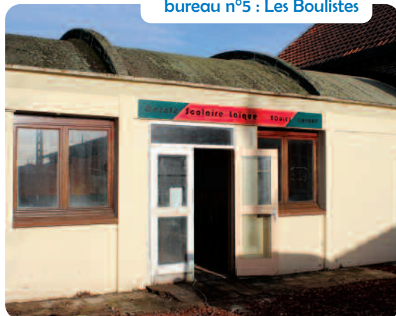
bureau n°5 : Les Boulistes

D'autres informations sont disponibles sur le site : www.interieur.gouv.fr