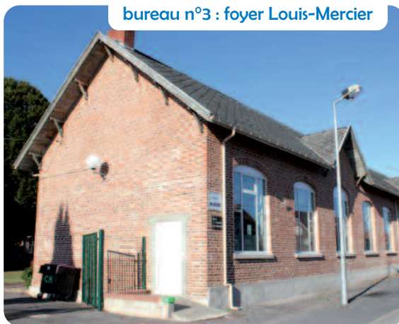
bureau n°3 : foyer Louis-Mercier

école Jacques-Prévert boulevard de l'église St Louis