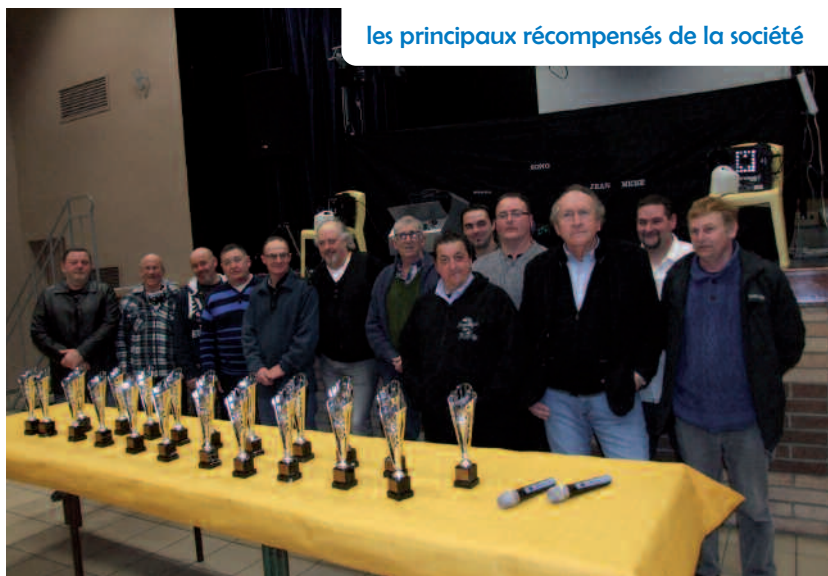
les principaux récompensés de la société

A la salle des Fêtes, les membres de l'association colombophile « la Résistance » se sont réunis à l'occasion d'un repas et d'une remise de coupes.