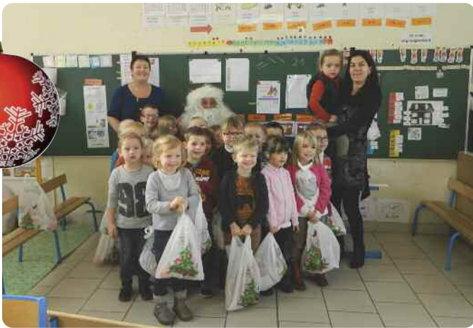
coquilles, oranges, chocolats, bonbons pour les élèves...