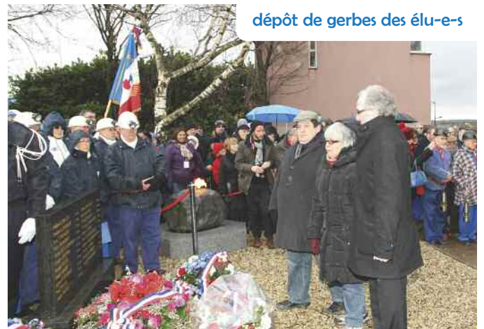
dépôt de gerbes des élu-e-s

Pour la ville, l'hommage à ces hommes, ce n'est pas seulement le 27 décembre, mais un peu tous les jours, puisqu'une plaque leur rend hommage dans le hall de notre hôtel de ville.