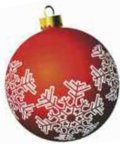
inauguration du marché de Noël

Lors de l'édition 2014, ce sont les bénévoles de l'Amicale du personnel et de la Section de basket qui ont mis en place le marché de Noël. Organisée à la salle des Fêtes avec le soutien de la commune, la manifestation a permis au public de découvrir les nombreux stands et animations prévus pendant les deux jours de l'événement. Le Père Noël était également au programme pour le plus grand plaisir des enfants.