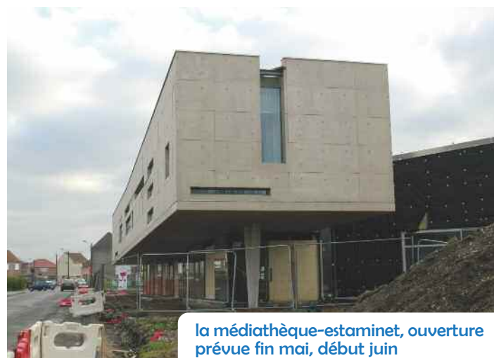
la médiathèque-estaminet, ouverture prévue fin mai, début juin

ment citée, aussi bien dans les revues d'architecture et de bâtiment que dans les revues des bibliothèques et de la lecture