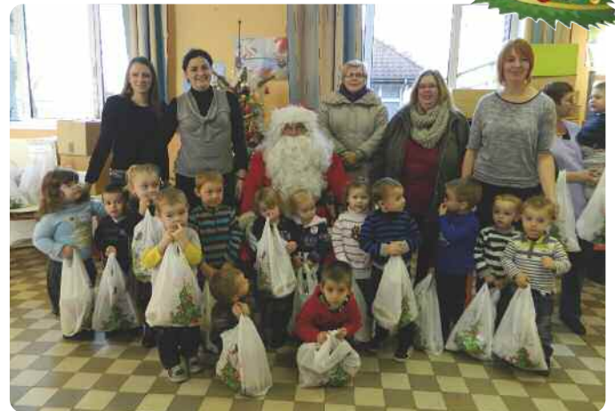
...et présence du Père Noël en personne.