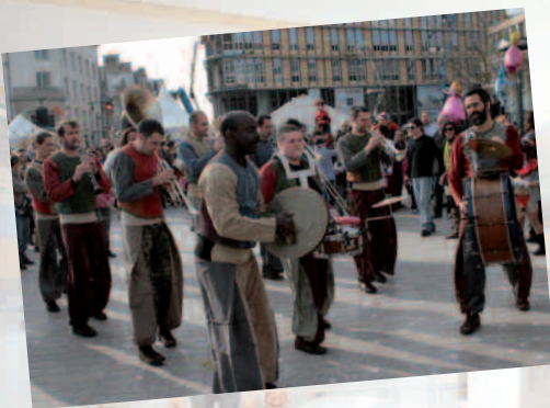
la Belle image