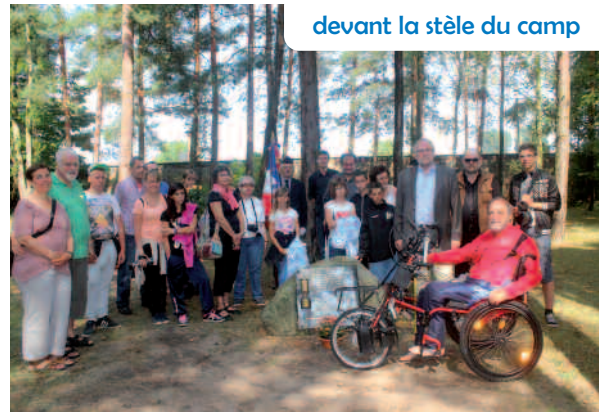
devant la stèle du camp