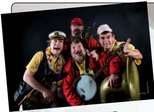
Les News Trompers