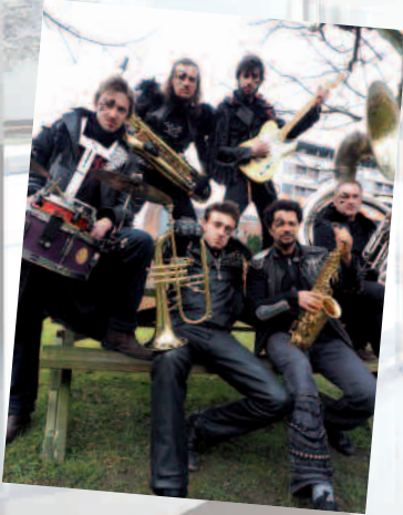
La roulote ruche par Mortal Combo