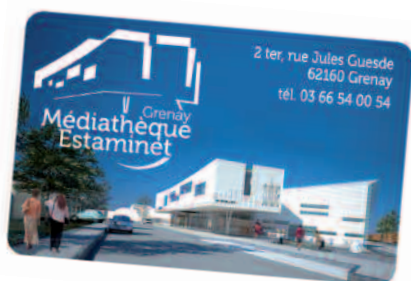
la nouvelle carte d'abonné-e