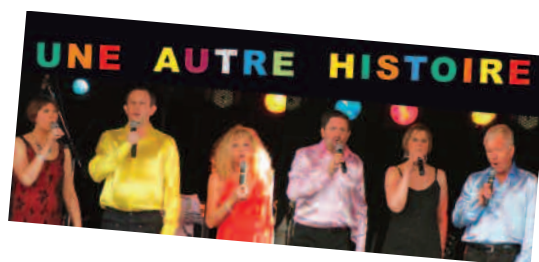
pour la 3 ème fois à Grenay