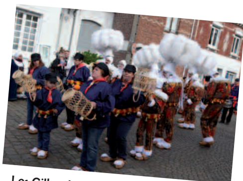
Les Gilles de Liévin