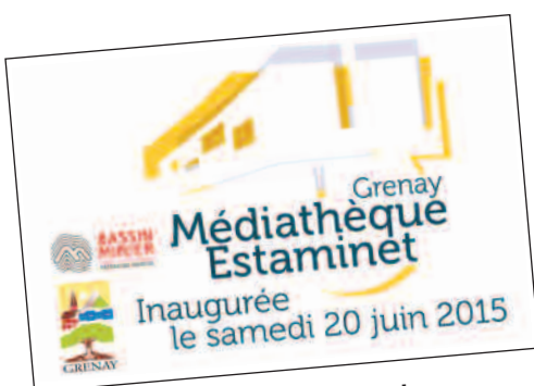
le timbre inaugural