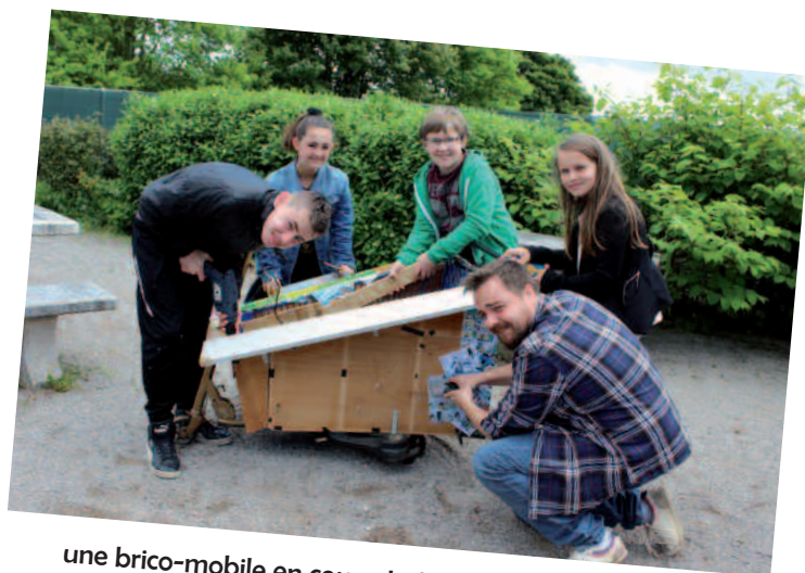
une brico-mobile en cours de fabrication avec les jeunes