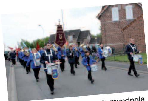
Notre Harmonie municipale