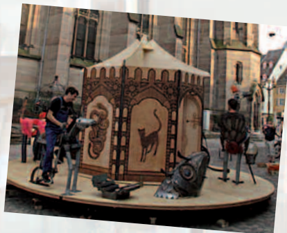
Le manège des 1001 nuits