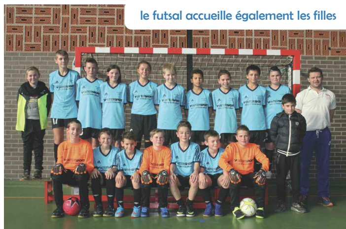
Le futsal accueille également les filles

pratique sportive, le lycée Henri-Darras de Liévin a ouvert une section en faveur de la pratique de cette discipline. Deux anciens élèves du collège l'ont intégrée en septembre.