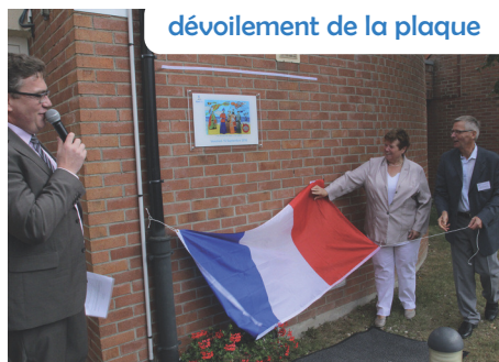
dévoilement de la plaque