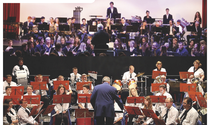
les 2 orchestres en concert

Gratuit, le concert durera environ deux heures.