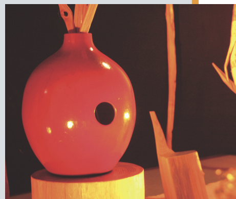
Mokofina, spectacle pour les petits

Réservation et renseignements au 03 66 54 00 54 .