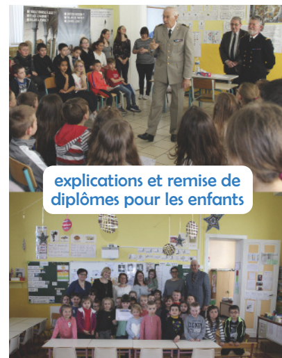
explications et remise de diplômes pour les enfants

L'action a été menée en partenariat avec l'association « Solidarité défense » qui contribue à soutenir les militaires en opération, les blessés, les invalides et les familles endeuillées.