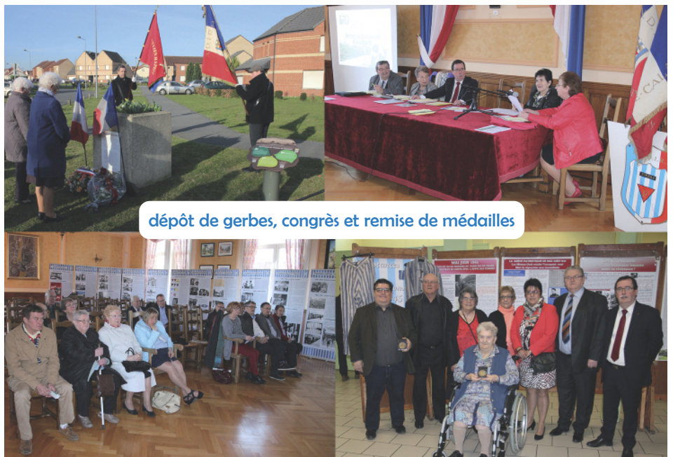
dépôt de gerbes, congrès et remise de médailles

Réunis à la salle des mariages, les militants bénévoles de la FNDIRP ont échangé autour du thème : « Paix et fraternité : les serments des déportés ». Au moment de la libération des camps de concentration, les déportés s'étaient jurés d'agir dans le monde pour une société de paix, de progrès social et démocratique. Tout le contraire des années d'horreur qu'ils avaient vécu à cause de la folie fasciste. Pour que ces heures sombres de notre histoire ne se reproduisent plus, les membres ont renouvelé leur volonté de sensibiliser les jeunes à cette mémoire et qui, ils l'espèrent, prendront la relève. Leur combat se traduit également par la lutte contre toutes les