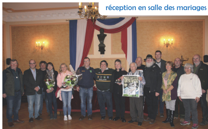
réception en salle des mariages