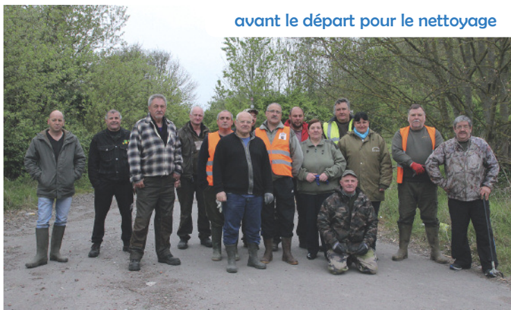
avant le départ pour le nettoyage

Les bénévoles de la société de chasse se sont réunis afin de prendre part à leur traditionnel nettoyage des terrils situés entre Grenay et Mazingarbe.