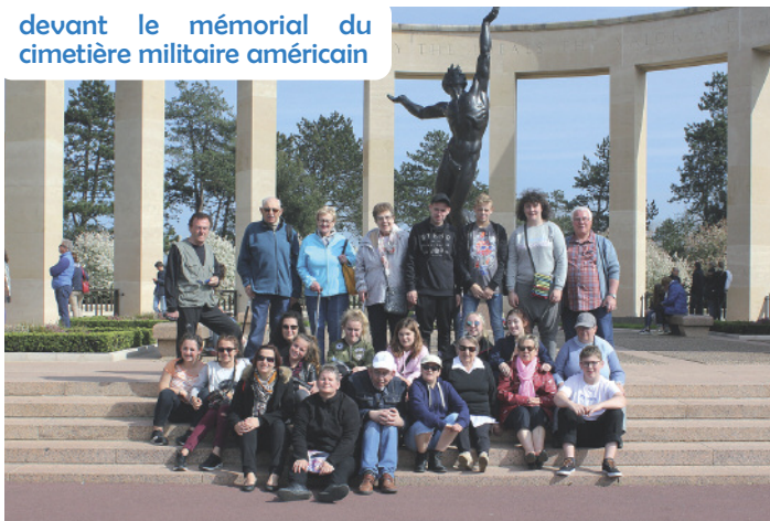
devant le mémorial du cimetière militaire américain