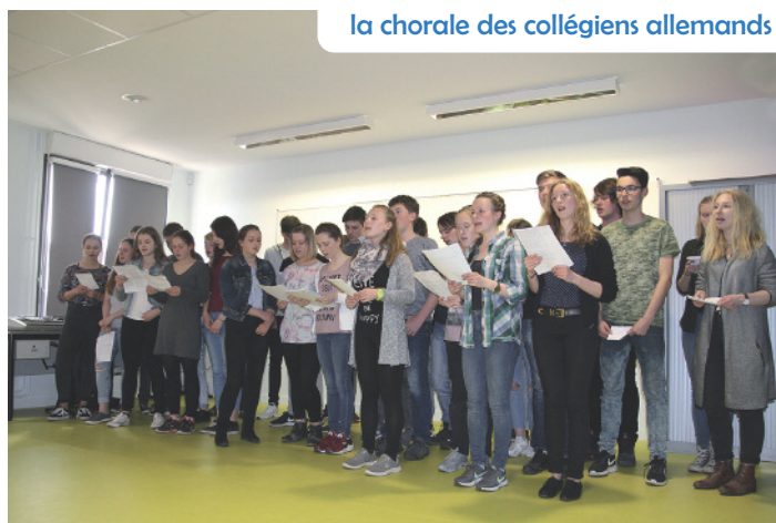
la chorale des collégiens allemands