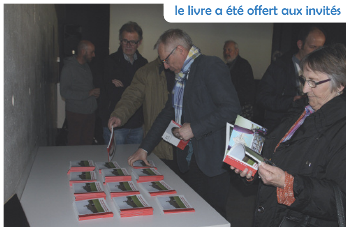
le livre a été offert aux invités

La réception s'est achevée par le verre de l'amitié offert par la ville.