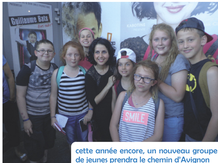
cette année encore, un nouveau groupe de jeunes prendra le chemin d'Avignon

Estaminet, c'est également des concerts. Le dernier en date est celui du 29 avril (concert The Strikes + LSA) et le prochain sera celui du samedi 3 juin à 20h30 (concert Blues Rock organisé par « Stage Struck » en hommage à Rory Gallagher.